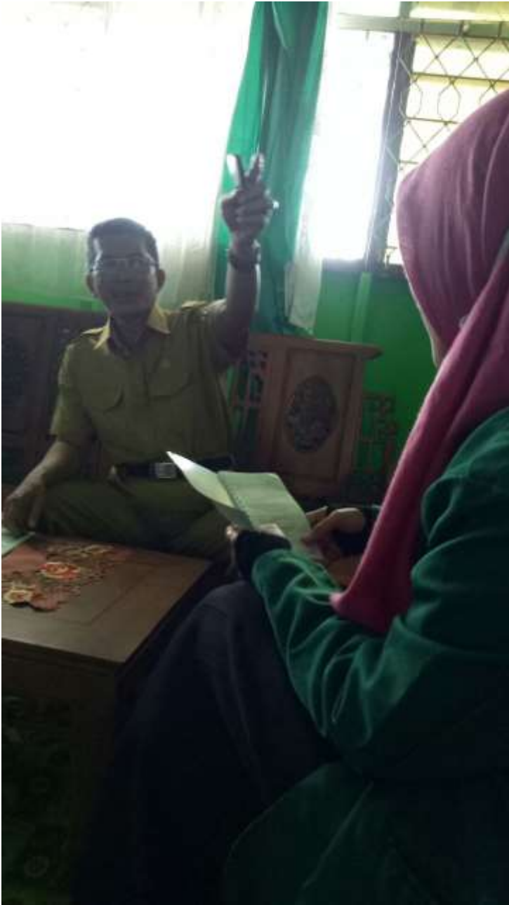
FOTO WAWANCARA DENGAN KEPALA SEKOLAH SMPN 2 MARABAHAN