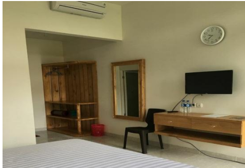
Foto-foto terkait Shaza Guest House Syariah Barabai