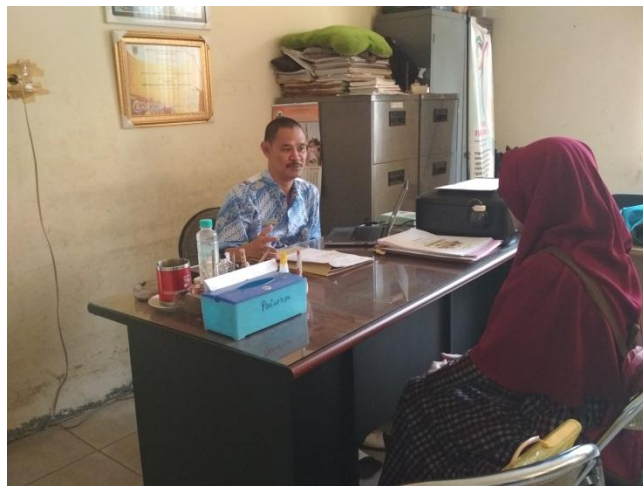
Dokumentasi wawancara dan pengambilan data terkait dengan Shaza Guest House Syariah Barabai di Dinas Kepemudaan, Olahraga dan Kepemudaan Kota Barabai