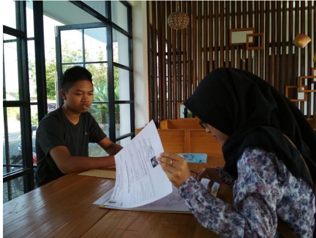
Dokumentasi wawancara dengan karyawan Shaza Guest House Syariah Barabai