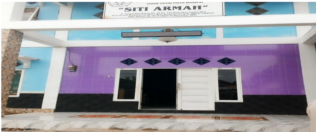
Nampak depan Panti Asuhan putri "Siti Armah" Kota Banjarmasin