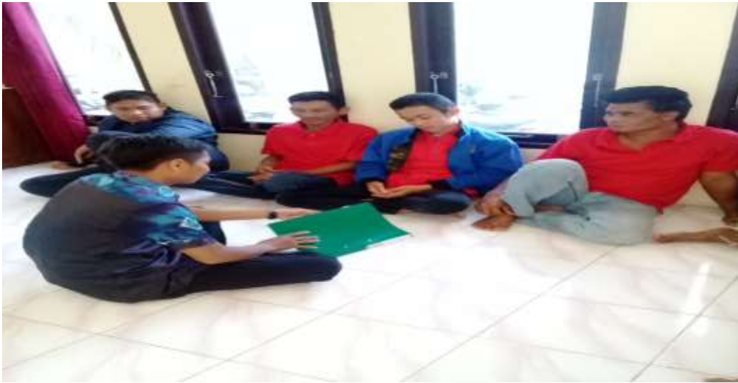
Foto tata cara dzikir