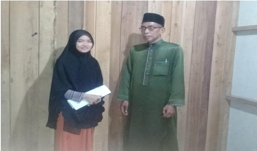
Wawancara bersama pemimpin panti asuhan Ahsanul Huda