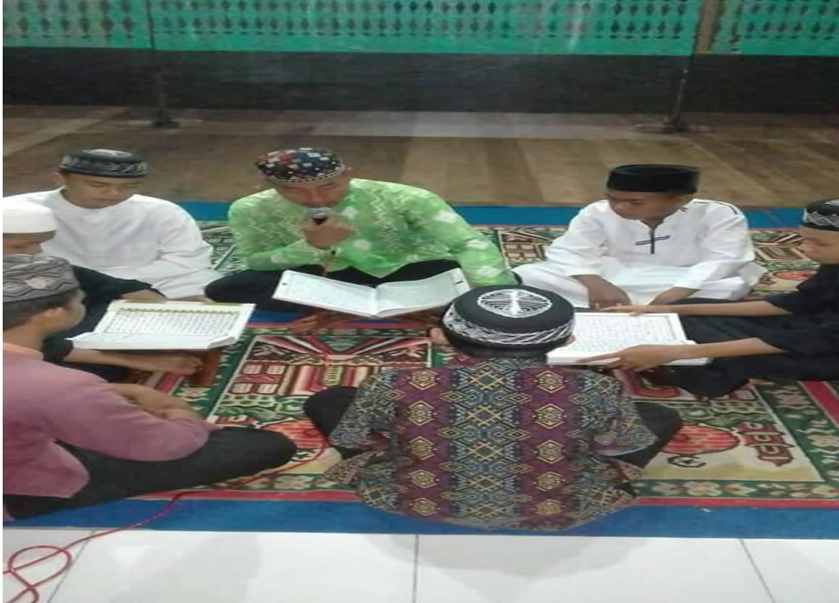
Acara tadarus Alquran oleh santri pada malam Ramadhan