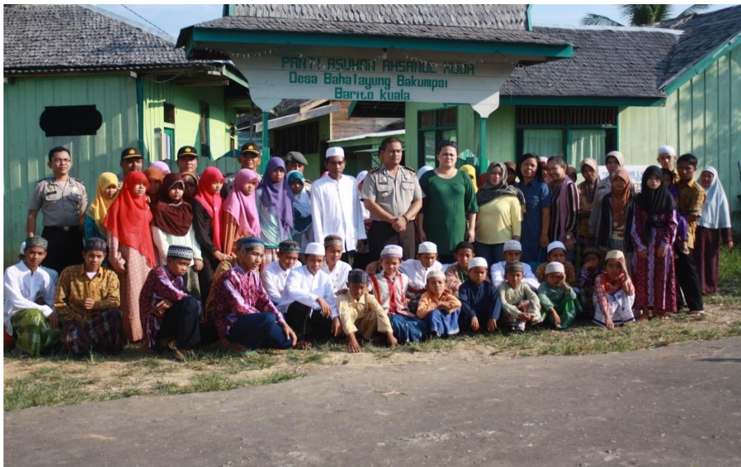
Kunjungan camat dan kapolres kab.Batola