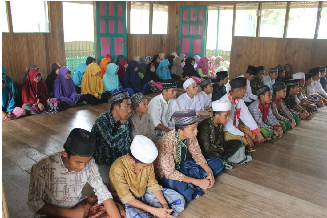
Acara ceramah-ceramah agama yang disampaikan oleh pemimpin panti