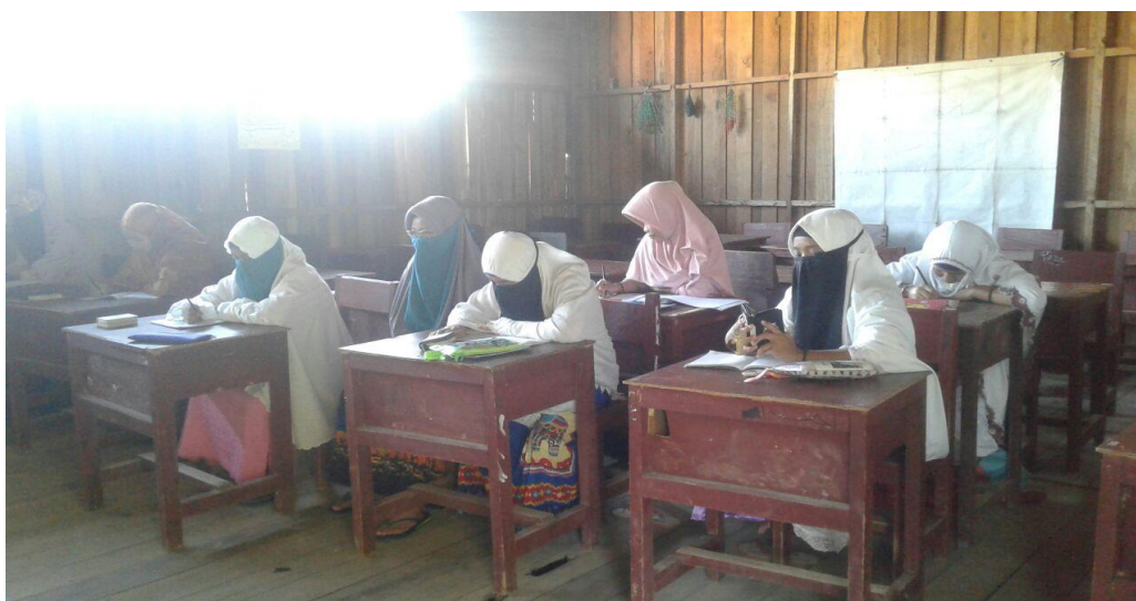
Pembelajaran TPA sore hari