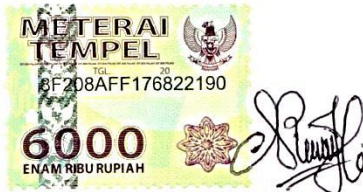
Noor Lailan Nazela