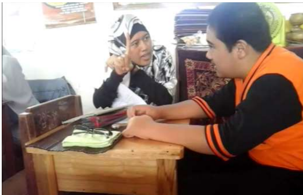
Gambar 3.2: Guru SDN 1.2 Belimbing Raya Kecamatan Murung Pudak saat menjelaskan pelajaran di Kelas kepada ABK Autis.