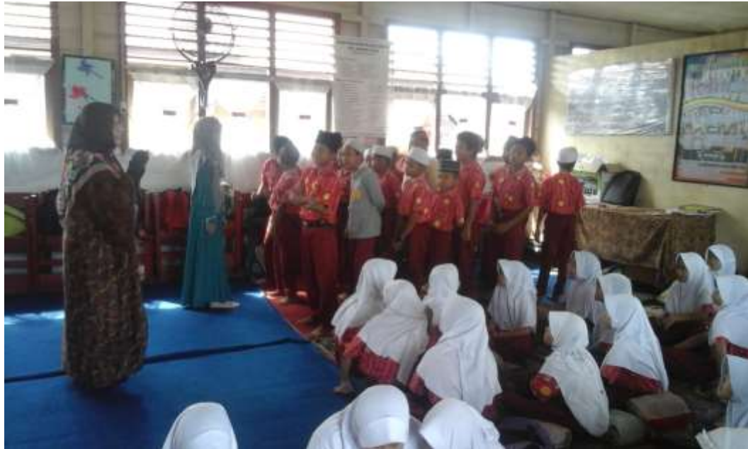
Gambar 4.1: Guru PAI SDN 1.2 Belimbing Raya Kecamatan Murung Pudak saat menjelaskan pelajaran Agama di Mushalla.