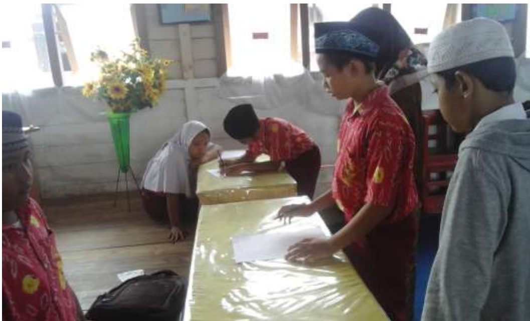
Gambar 1.2: Latihan menyusun ayat-ayat Alquran surah pendek di Mushalla Sekolah.