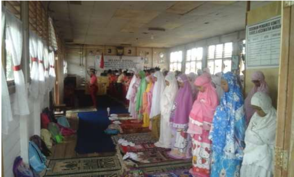
Gambar 2.1: Shalat Dhuha berjamaah di Mushalla Sekolah.