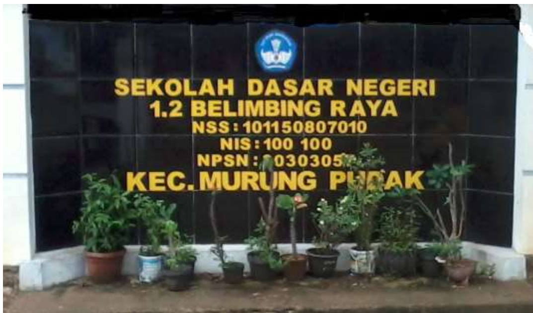
Gambar 4.2: Depan Sekolah SDN 1.2 Belimbing Raya Kecamatan Murung Pudak.