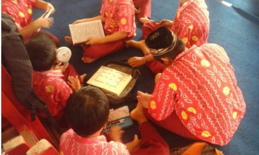
Gambar 1.1: Murid SDN 1.2 Belimbing Raya Kecamatan Murung Pudak saat belajar baca tulis Alquran.