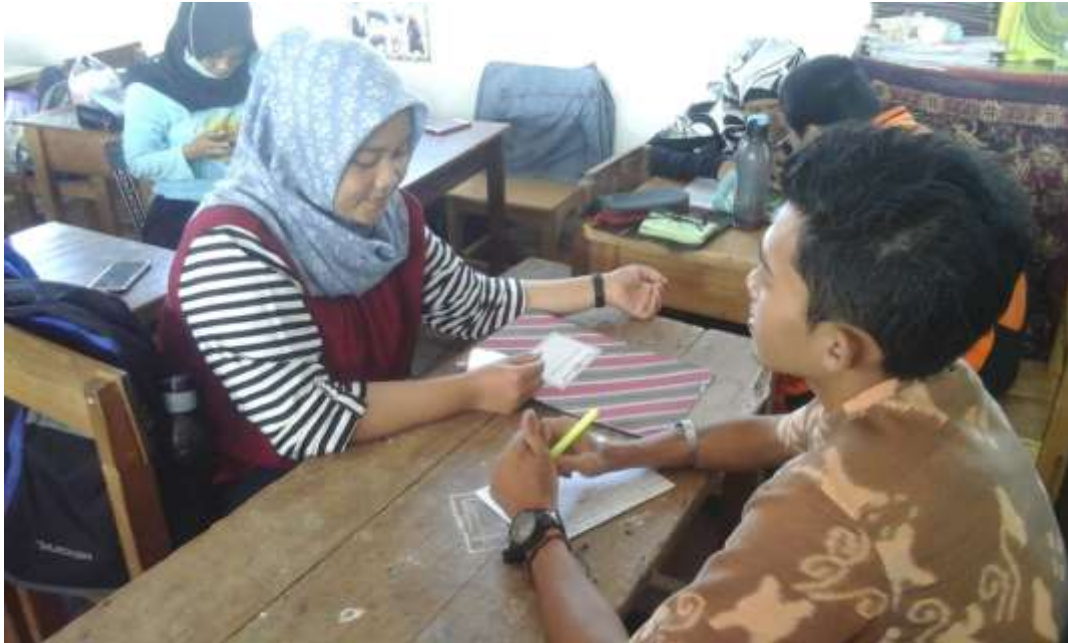
Gambar 3.1: Saat wawancara dengan RN, guru pendamping ABK Autis.