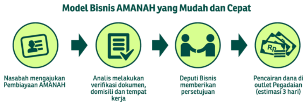
Gambar 2. Pembiayaan Kendaraan Bermotor Amanah pada Pegadaian Syariah