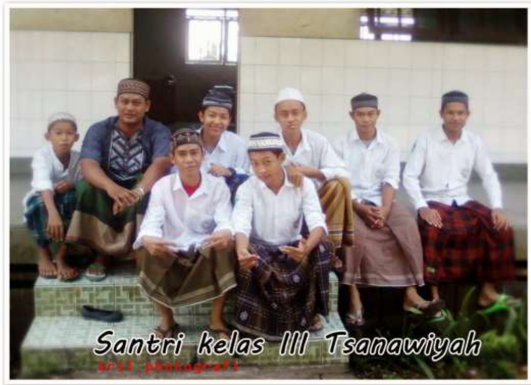
Santri kelas III Tsanawiyah