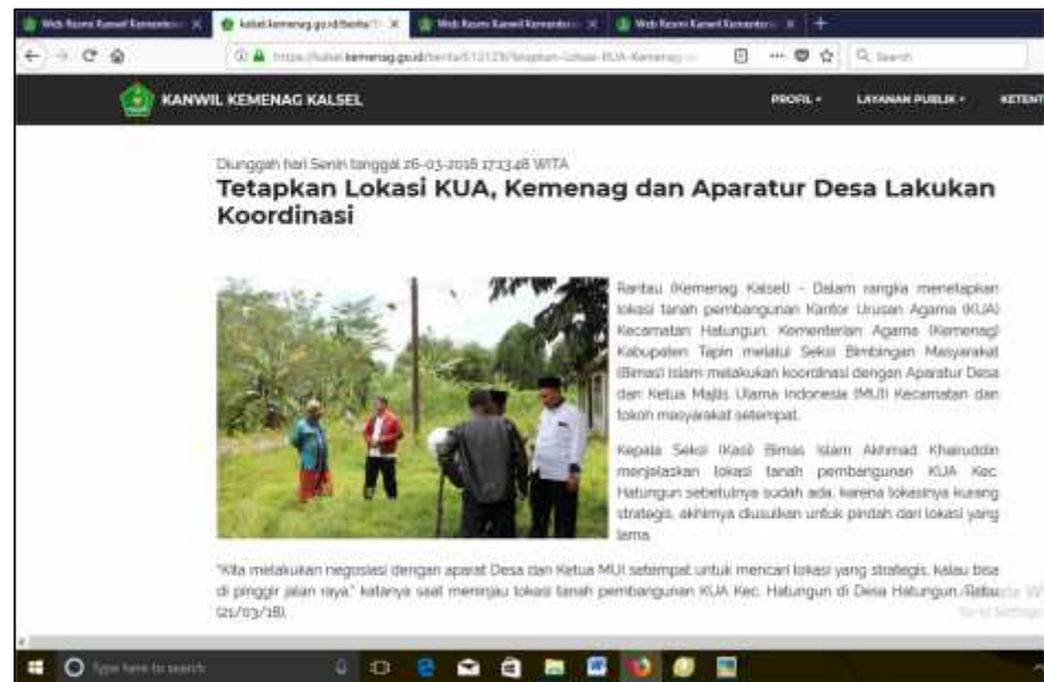
Gambar 4.5 26