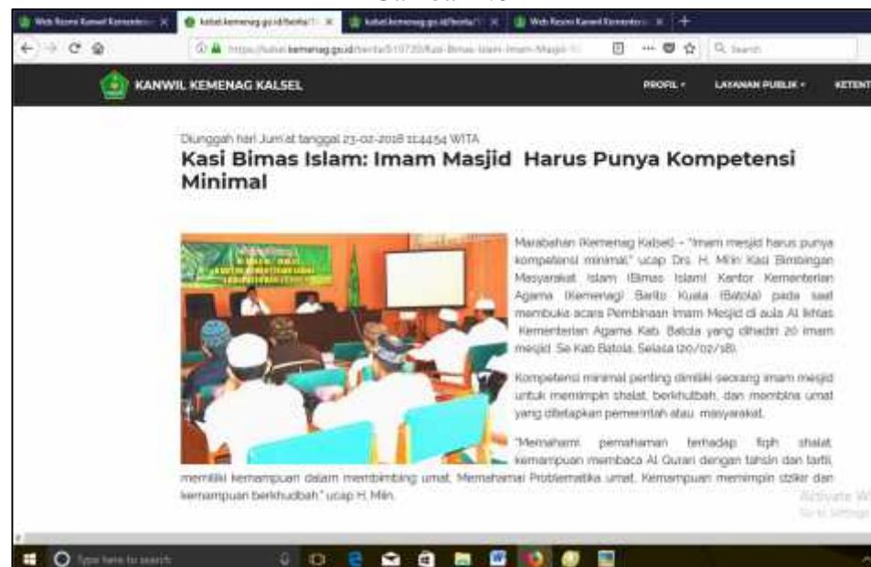
Gambar 4.6 27