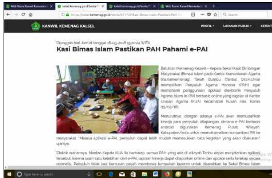
Gambar 4.13 34