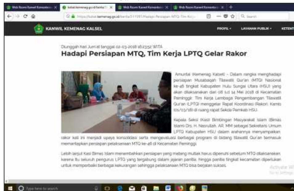
Gambar 4.14 35