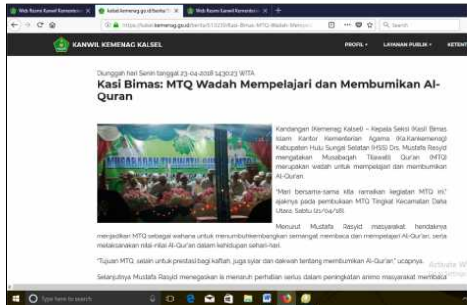
Gambar 4.17 38