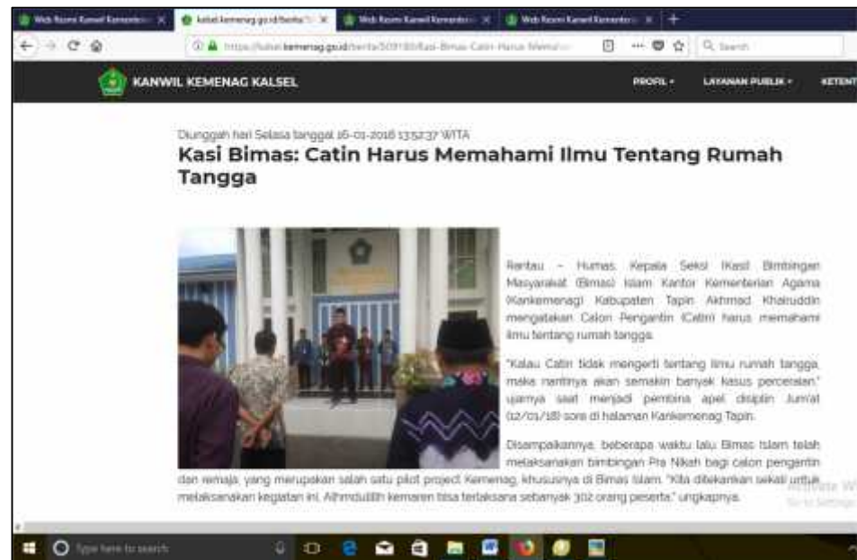
Gambar 4.9 30