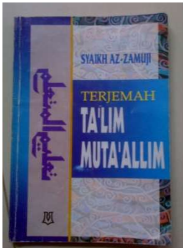
1.2. Gambar Sampul Terjemahan kitab Ta'lim al-Muta'allim Syeik Az- Zarmuji