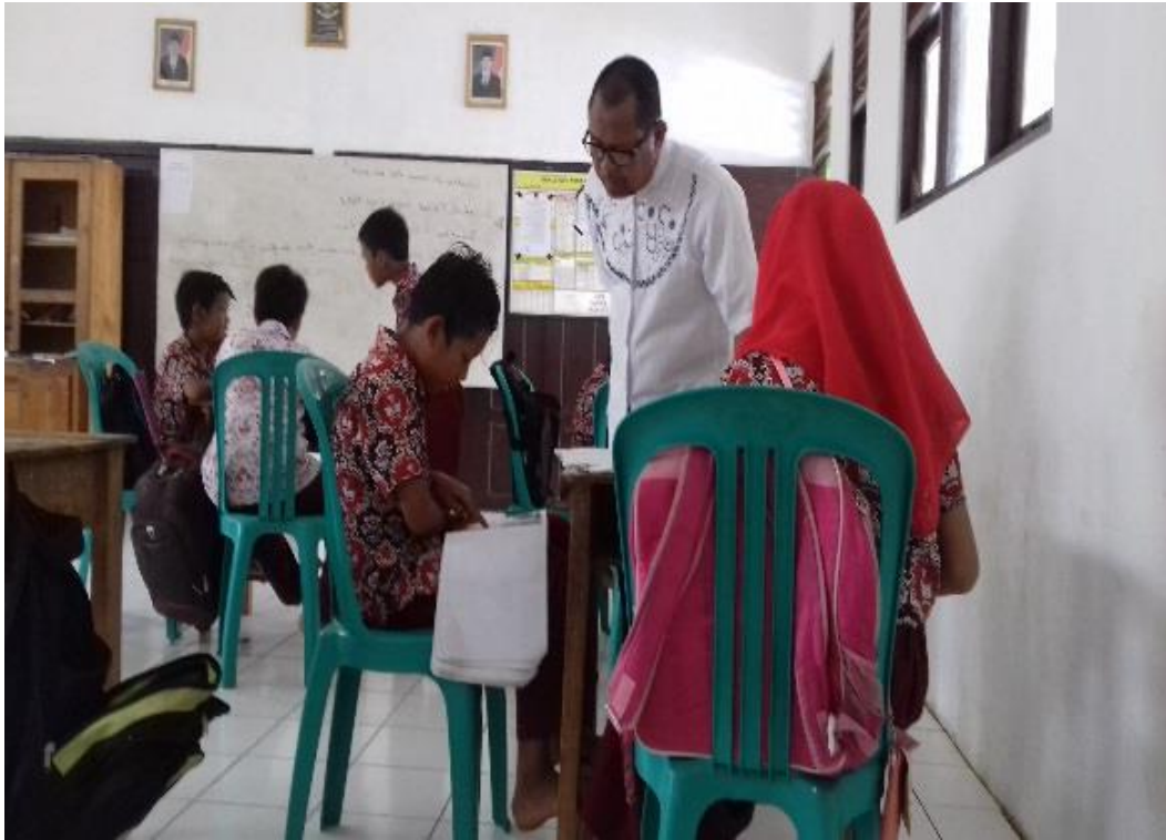
KEGIATAN BELAJAR MENGAJAR PAI DI SDN PARING GULING