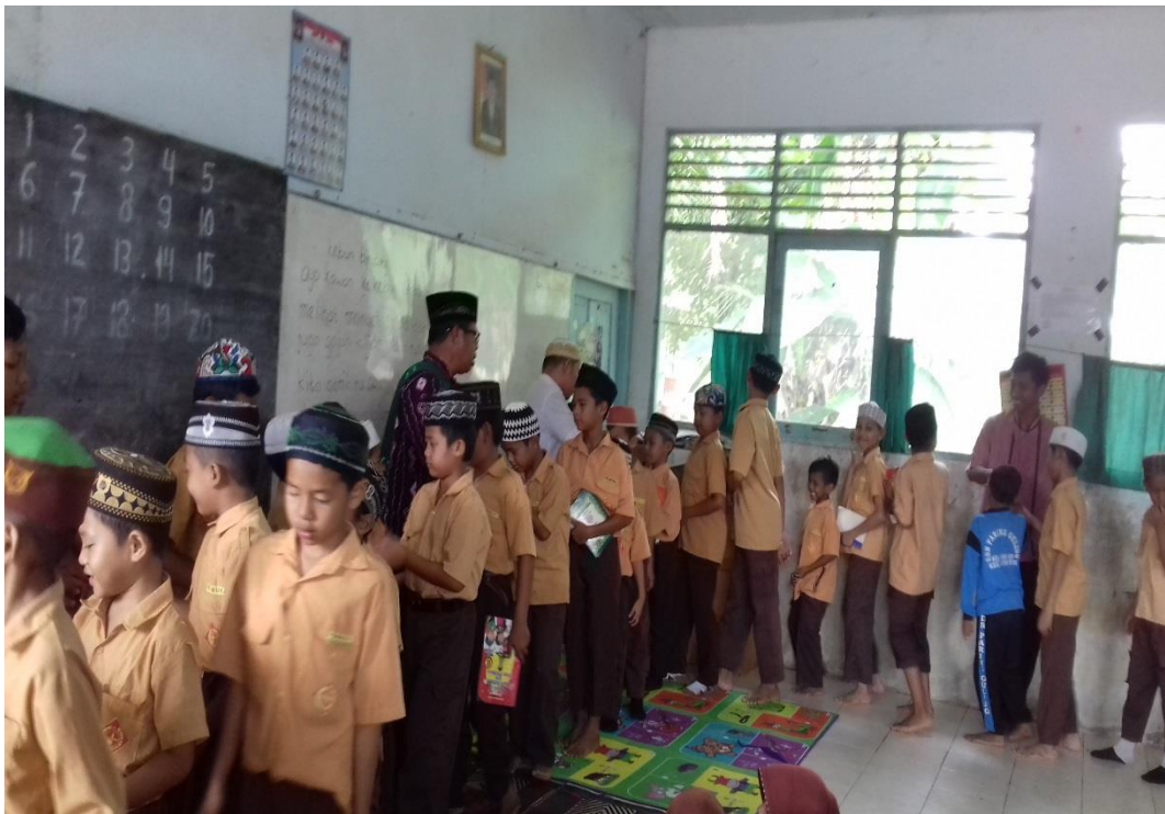
ANAK DIDIK SDN PARING GULING BERSALAM-SALAMAN DENGAN DEWAN GURU SETELAH PELAKSANAAN JUM'AT TAQWA