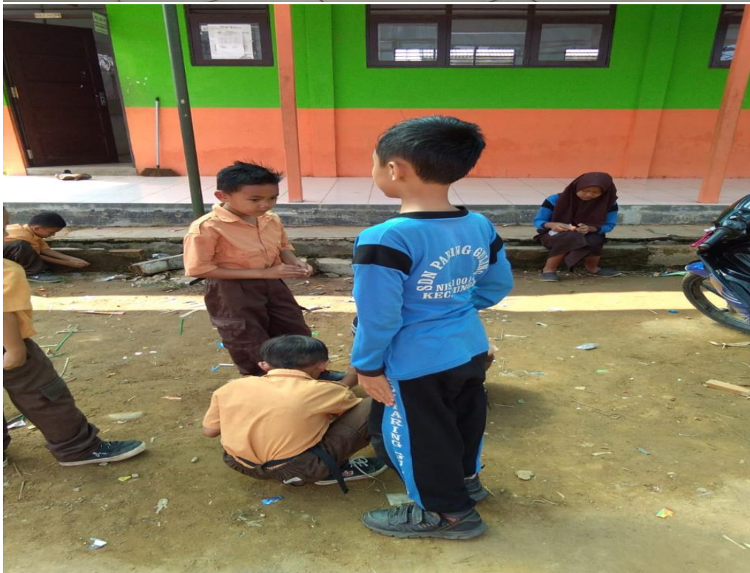
ANAK-ANAK DIDIK SDN PARING GULING DALAM PERGAULANNYA DI LINGKUNGAN SEKOLAH