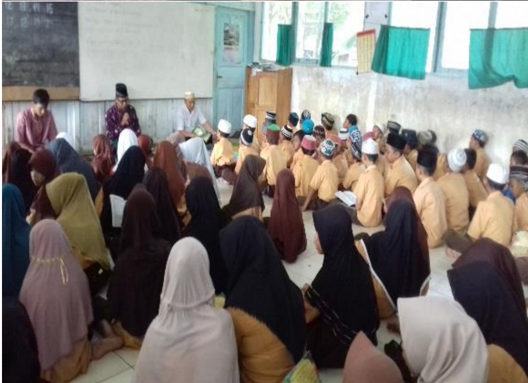
GERAKAN JUM'AT TAKWA SDN PARING GULING