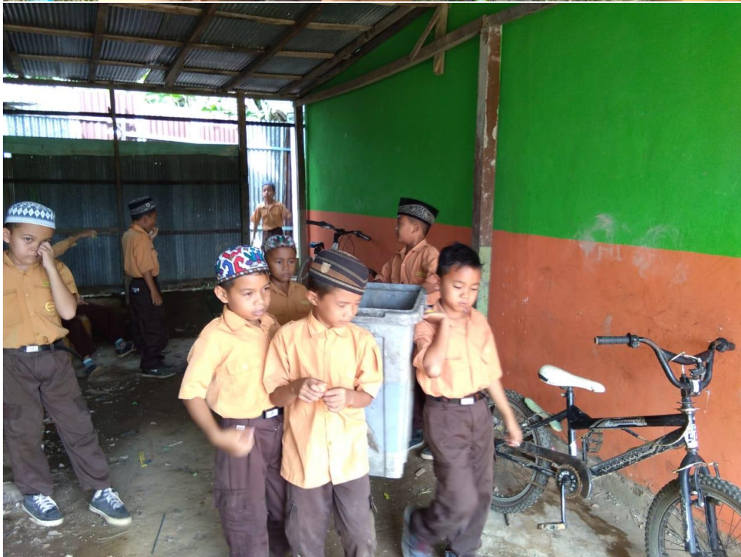
ANAK DIDIK SDN PARING GULING BERGOTONG-ROYONG