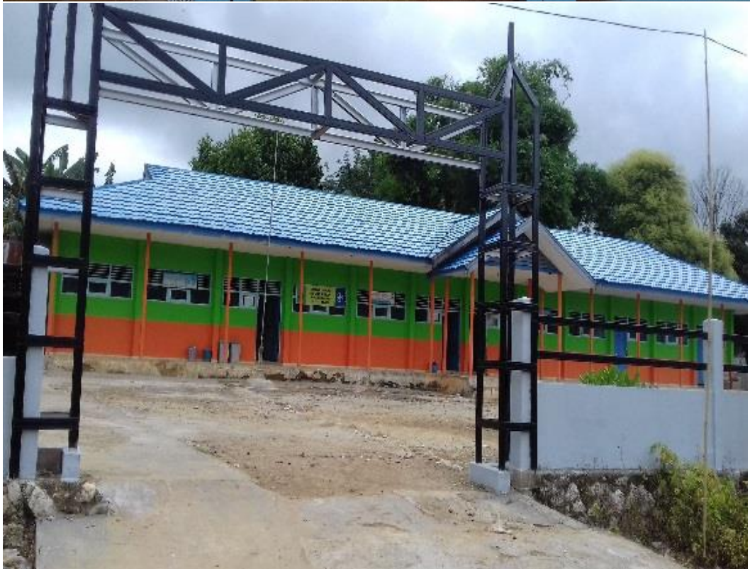
SDN PARING GULING