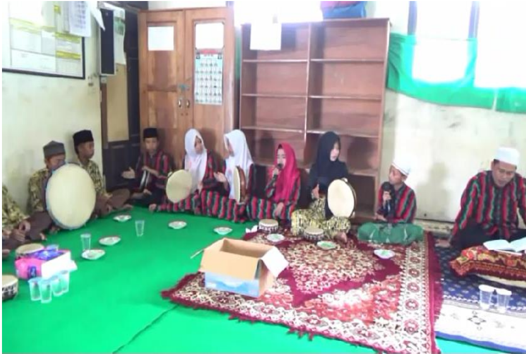
ANAK DIDIK SDN PARING GULING MENAMPILKAN SENI MAULID HABSYI PADA ACARA ISRA MI'RAJ