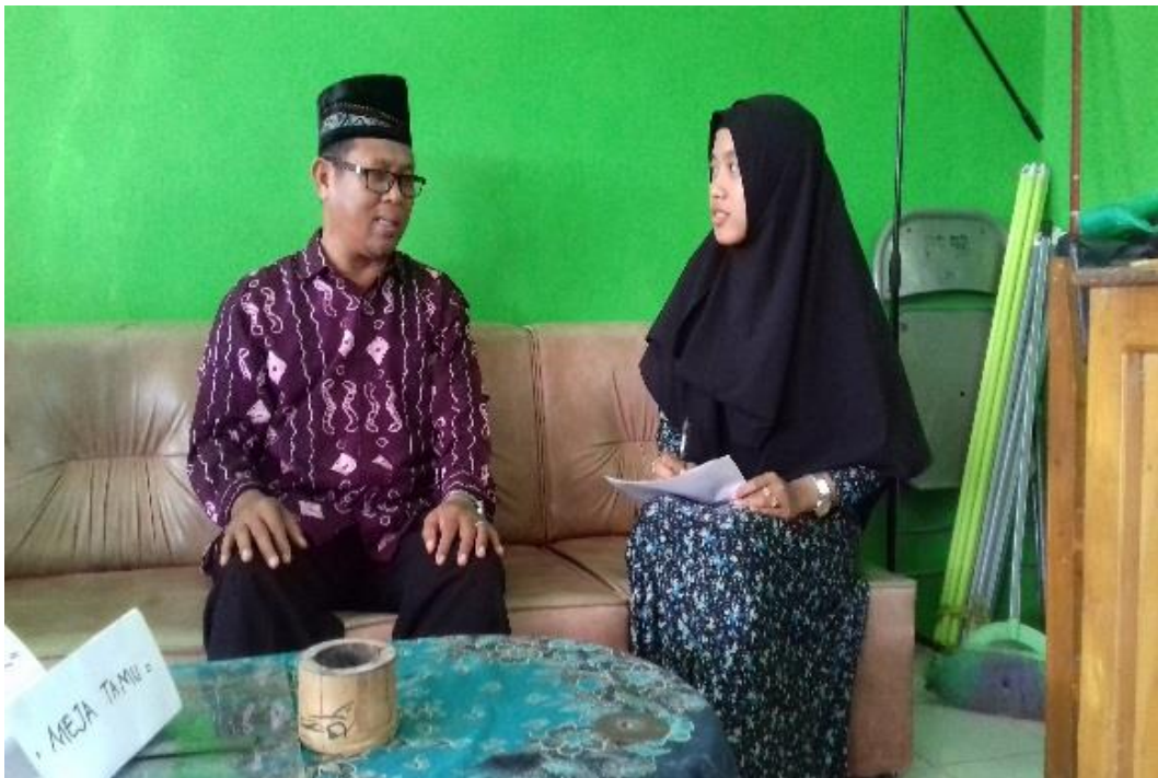
WAWANCARA DENGAN GURU PAI SDN PARING GULING