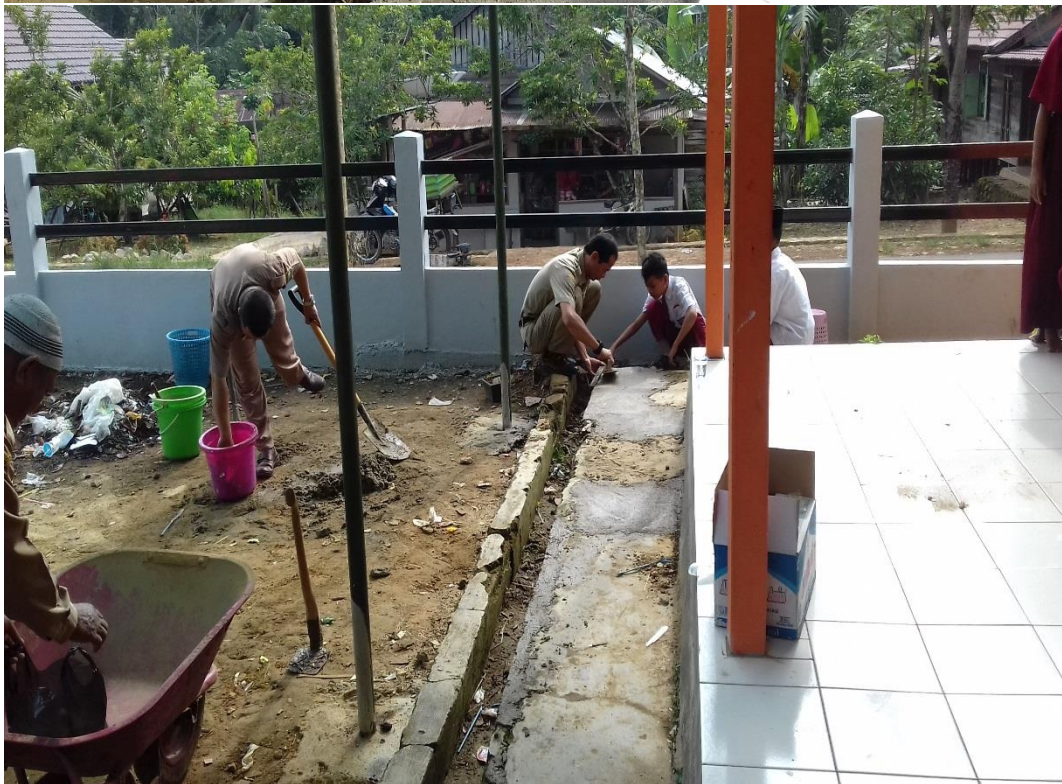
DEWAN GURU DAN ANAK DIDIK SDN PARING GULING BEKERJASAMA MEMPERBAIKI TERAS KELAS