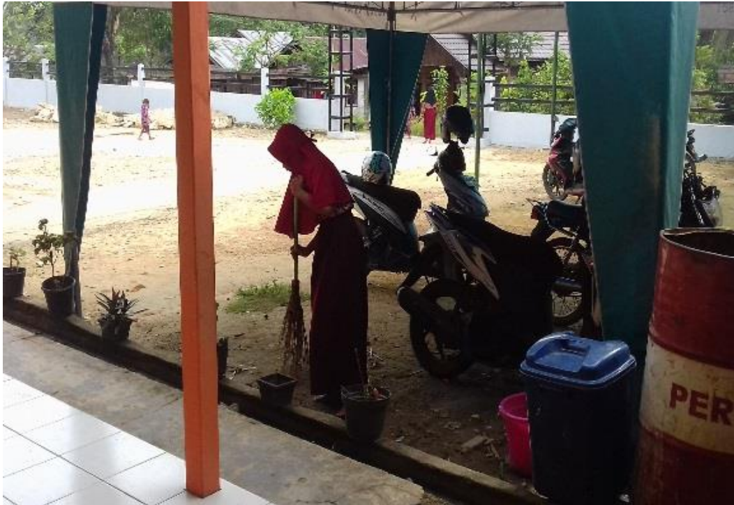
ANAK DIDIK SDN PARING GULING MEMBERSIHKAN LINGKUNGAN SEKOLAH