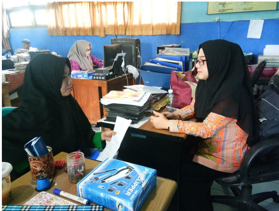
Interview with English Teacher of SMK Muhammadiyah 3 Banjarmasin