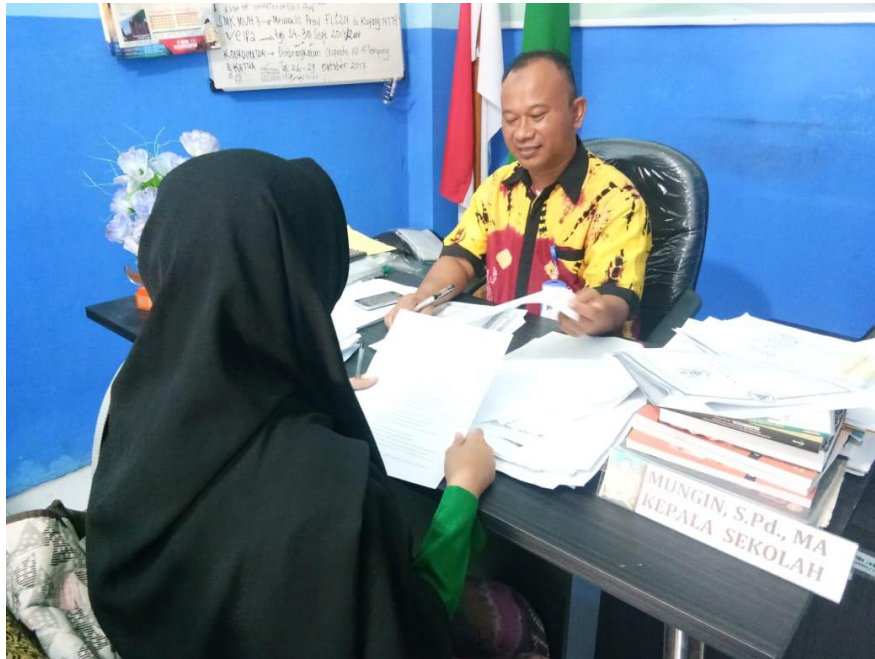
Interview with the Principal of SMK Muhammadiyah 3 Banjarmasin