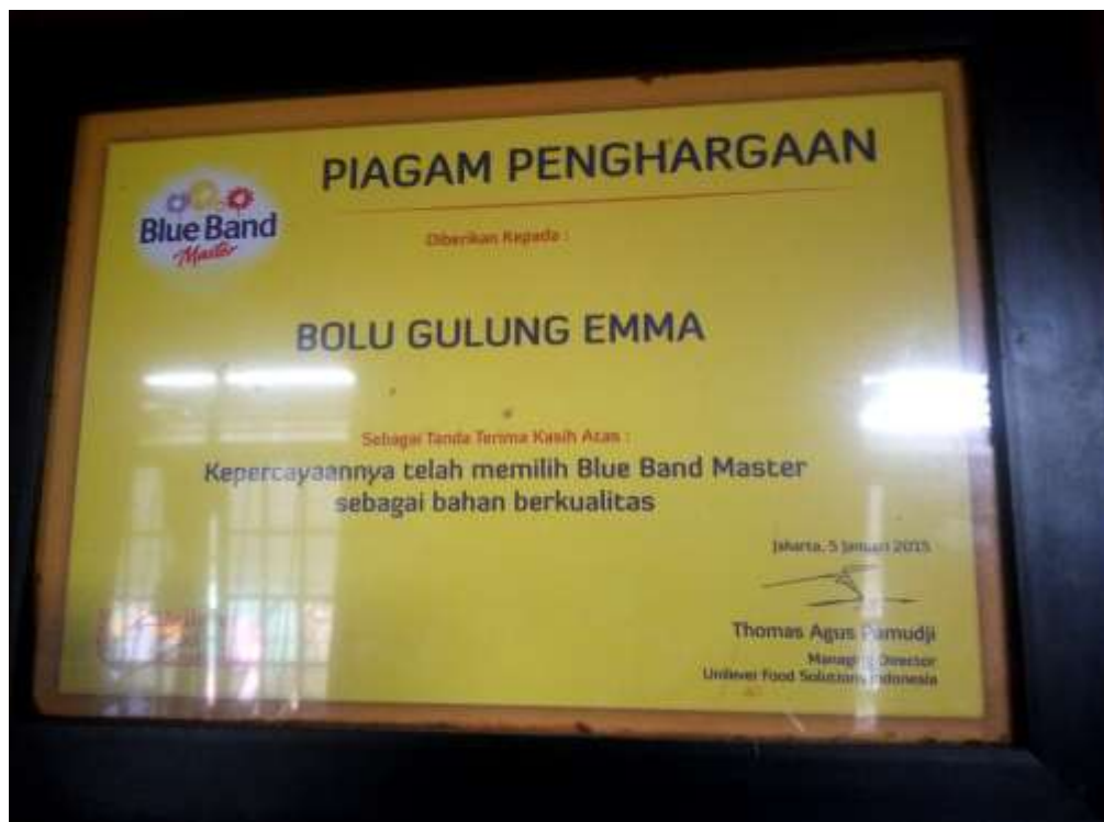
Salah satu bahan baku yang dipakai dalam produksi Hj. Enong Bakery.