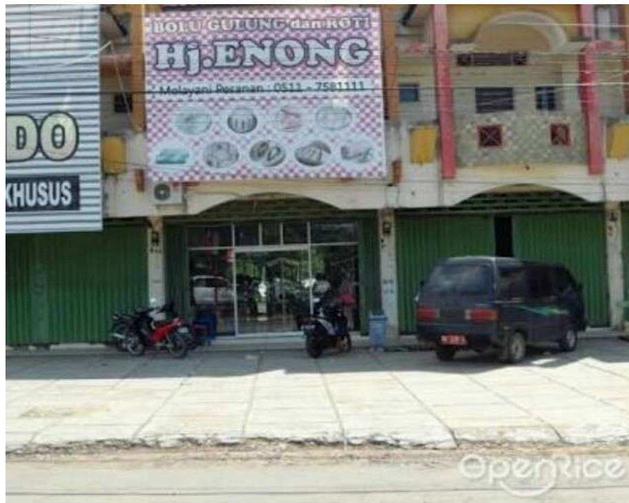
Salah satu foto penjaja atau menjual produk Hj. Enong Bakery.