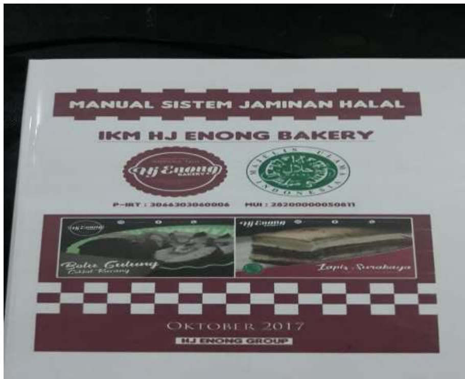
Foto sertifikat berlebel halal dari MUI (Majelis Ulama Indonesia)