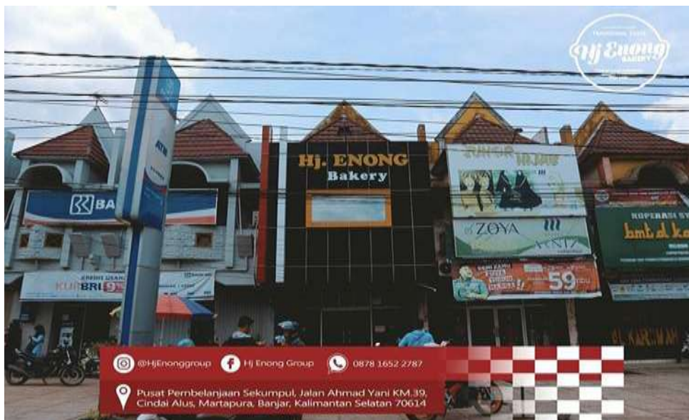
Foto toko cabang pertama di Jl. A. Yani km 39 Martapura.