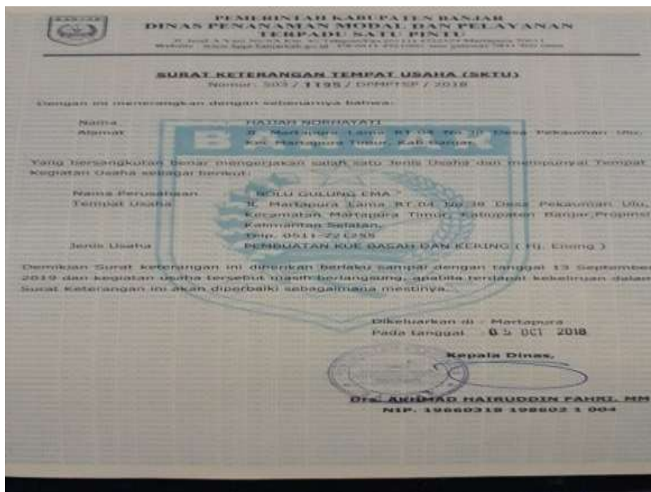
Surat Keterangan Tempat Usaha (SKTU) Hj. Enong Bakery