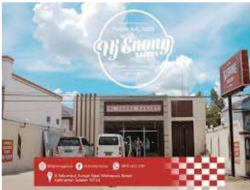
Beberapa foto cabang usaha Hj. Enong Bakery yang ada di Banjarmasin.