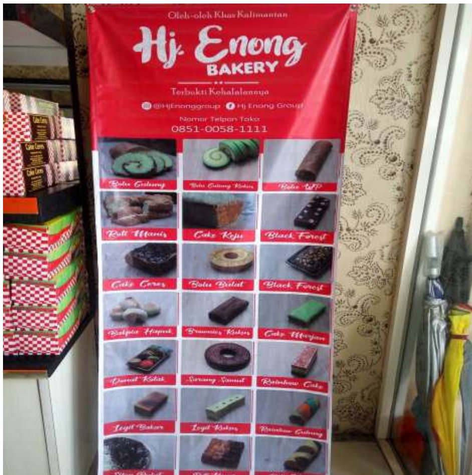
Foto menu yang ada di Hj. Enong Bakery