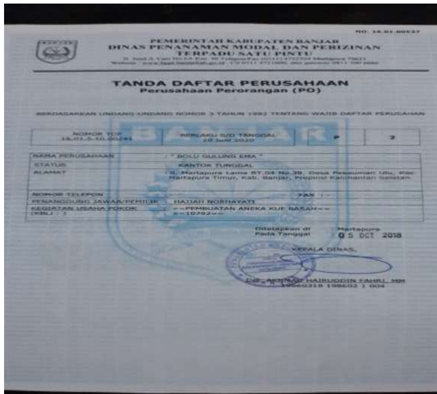
Foto tanda daftar perusahaan Hj. Enong Bakery