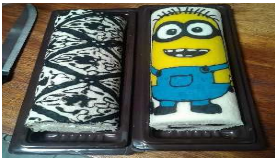
Salah satu foto produk yang berinovasi tetapi masih memuat unsur ketradisionalisan.