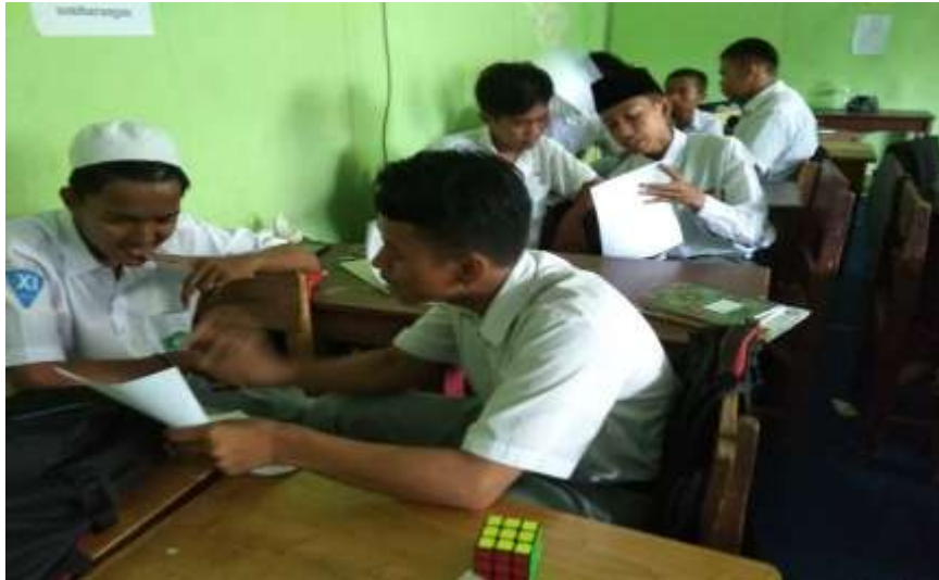
Gambar I. Pembicara Pertama Menjelaskan kepada Pendengar