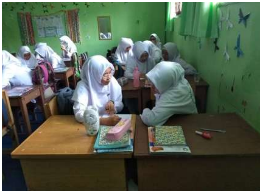
Gambar II. Pembicara Kedua Menjelaskan kepada Pembicara Pertama sebagai Pendengar