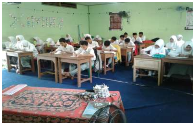
Gambar V. Siswa mengerjakan soal tes akhir Posttest