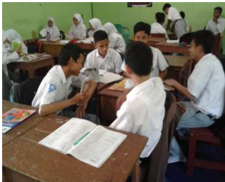
Gambar IV. Siswa berdiskusi tentang soal yang diberikan