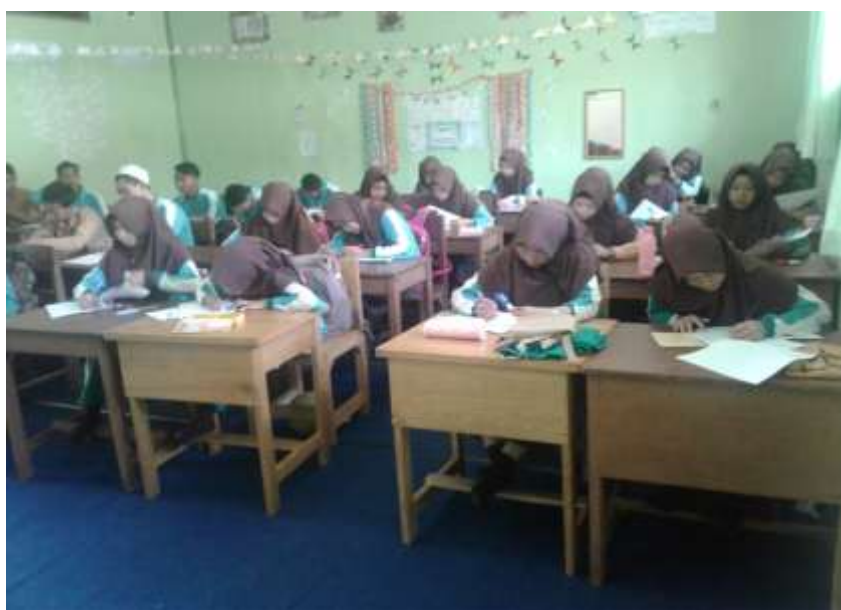
Gambar III. Siswa Mengerjakan Soal Tes Akhir Posttest

Setelah melaksanakan pembelajaran matematika menggunakan model Cooperatif Script dalam pembelajaran maka pada pertemuan terakhir maka akan dilaksanakan tes akhir, dilakukan untuk mengukur tingkat penguasaan materi yang terkait dengan materi yang diajarkan, dalam mengajarkan tes akhir, setiap siswa tidak boleh saling membantu sama lain.