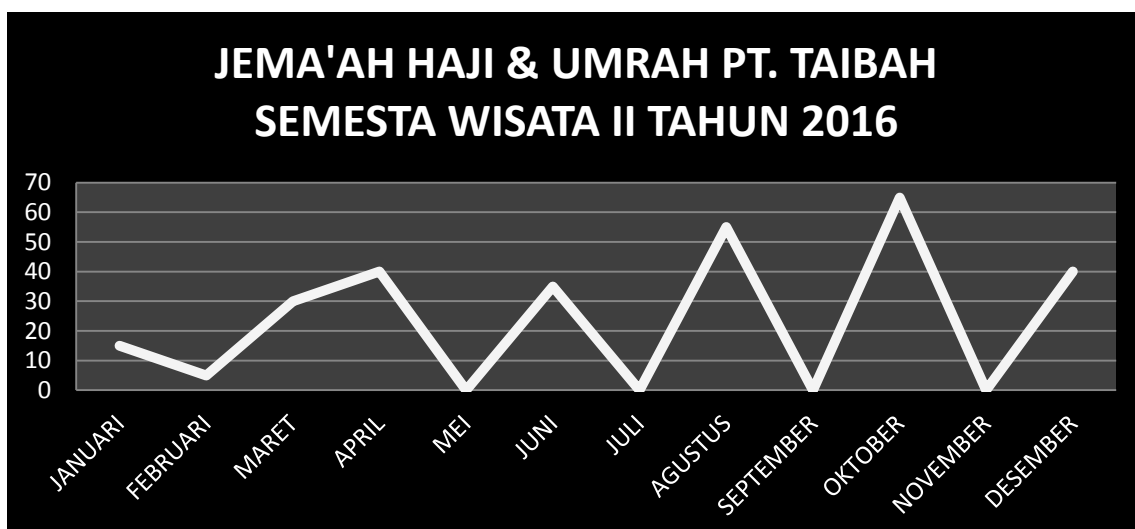
Jemaah Haji Dan Umrah PT. Taibah Semesta Wisata II Kota Banjarmasin Tahun 2016