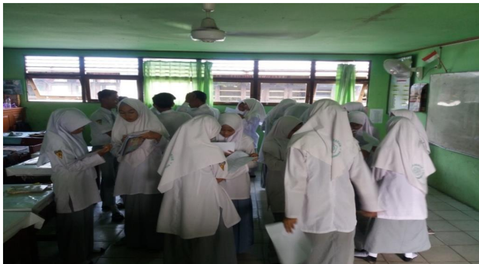
Gambar III. Langkah keenam model IOC saat siswa di lingkungan besar yang berbagi informasi.