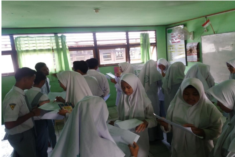
Gambar II. Langkah kelima model IOC saat siswa di lingkungan kecil berbagi informasi.

Aktivitas pembelajaran siswa dengan menggunakan model pembelajaran Inside-Outside-Circle (IOC) berikut ini.