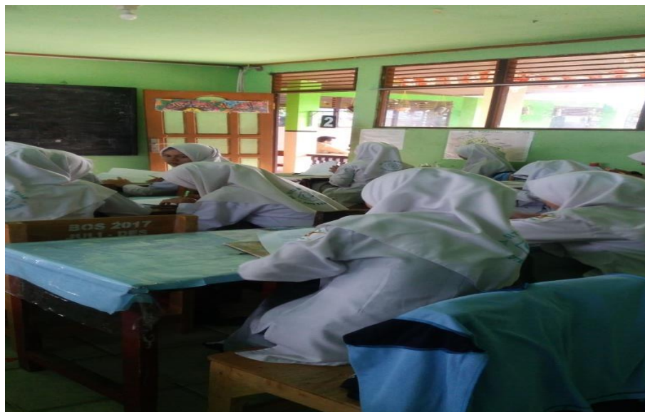
Gambar I. Kegiatan Siswa di kelas.

Aktivitas siswa ketika proses belajar mengajar berlangsung pada saat penyajian materi bisa dilihat pada gambar berikut ini.