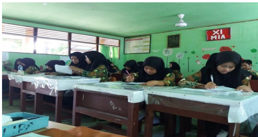
Gambar IV. Siswa saat mengerjakan tes akhir.

Aktivitas siswa ketika mengerjakan tes akhir hasil belajar dan aktivitas siswa dapat dilihat dari gambar berikut ini.