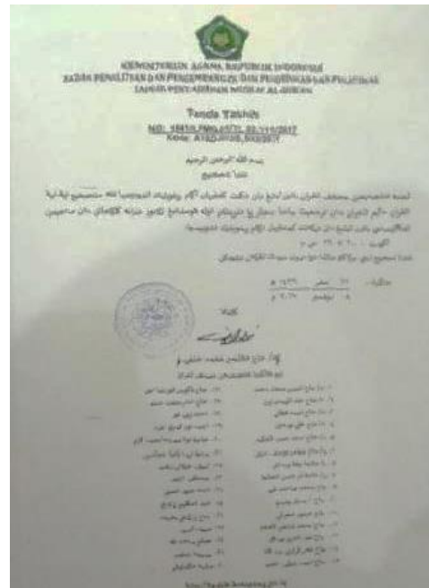
Gambar 3.1 Lembar Pengesahan dari Lajnah Pentashih Al-Qur'an