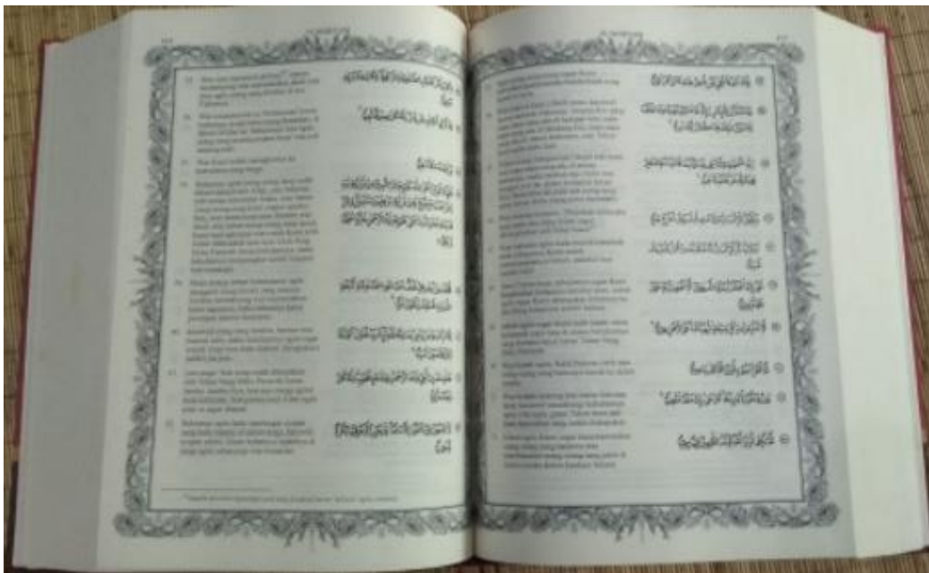
Gambar 3.3 Halaman isi