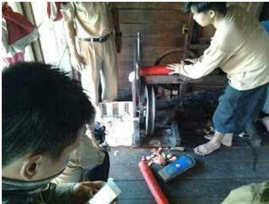
Cara menggunakan alat pemotong kerupuk singkong.