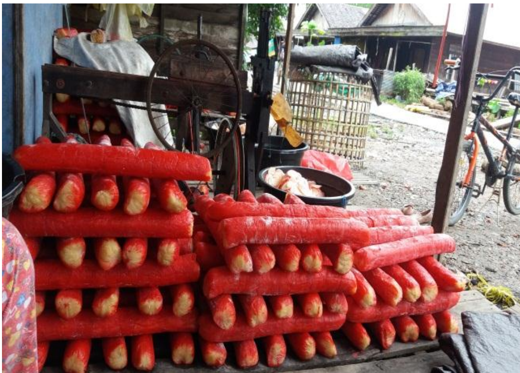
Saat tahapan pemotongan dengan menggunakan alat pemotong .