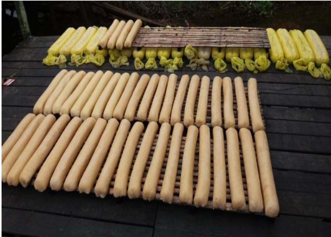
Setelah di jemur maka bungkusnya dapat di lepas dan masih dalam tahap penjemuran.