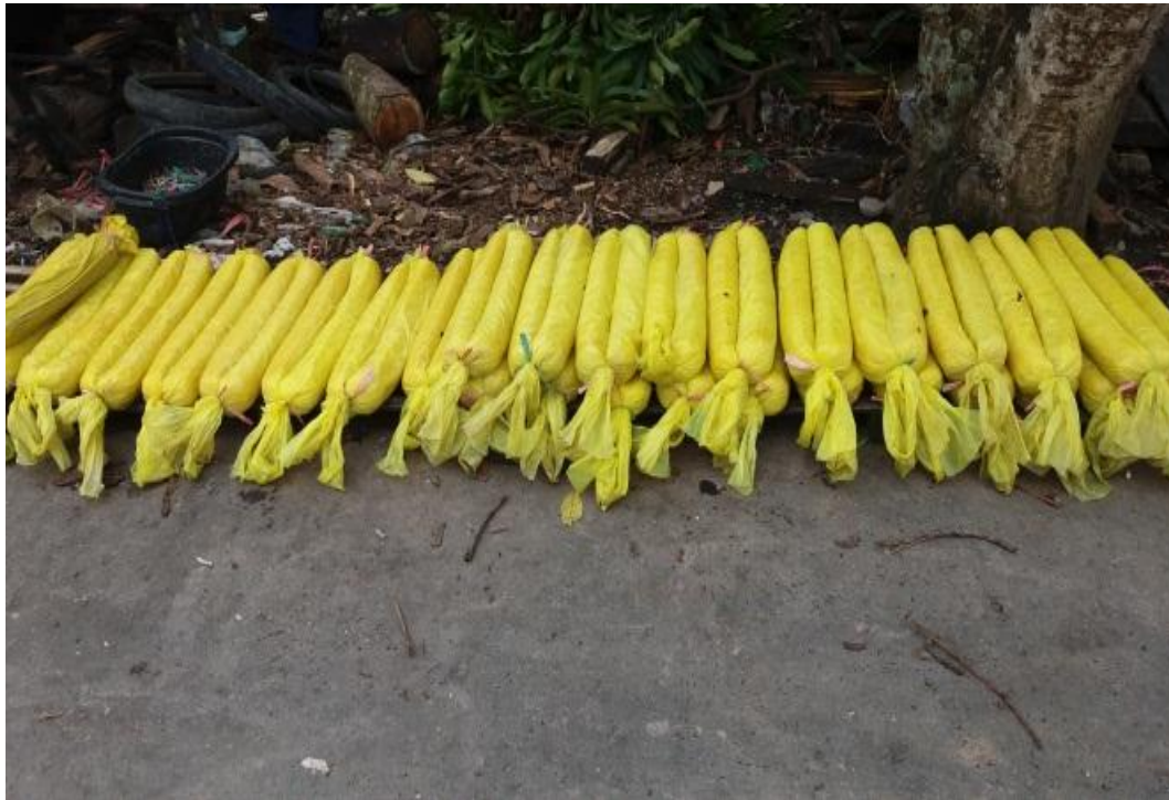
Saat penjemuran singkong yang sudah dihaluskan dan direbus tadi. setelah direbus, didiamkan beberapa hari.