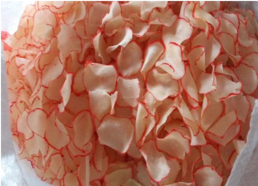
Kerupuk singkong yang sudah dijemur.