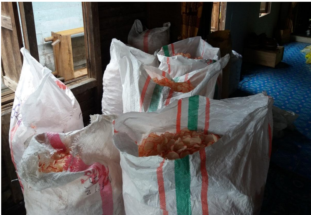
Kerupuk singkong yang sudah siap dijual.