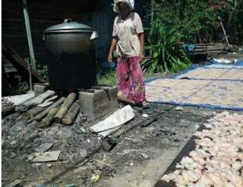
Saat merebus singkong yang sudah dikupas.