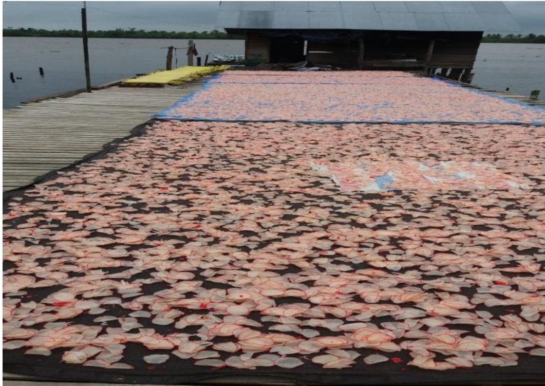
Tahap penjemuran kerupuk singkong yang sudah di potong tipis-tipis.