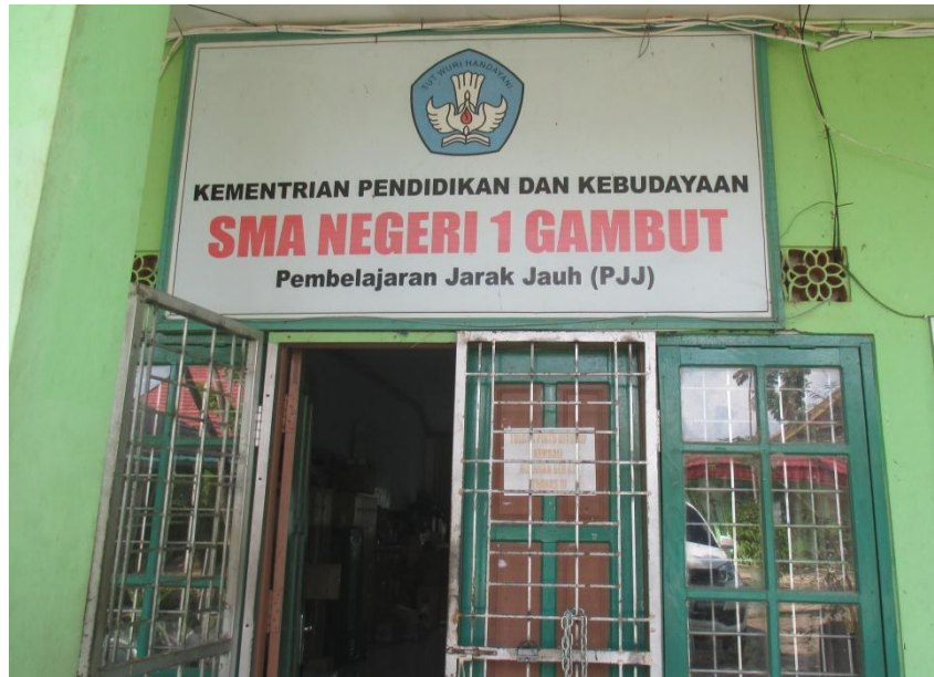
Ruang Kantor Pembelajaran Jarak Jauh (PJJ) di SMAN 1 Gambut