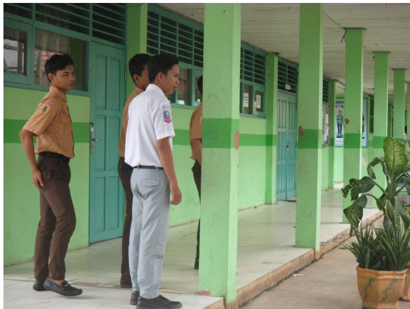
Gambar lingkungan belajar di SMAN 1 Gambut