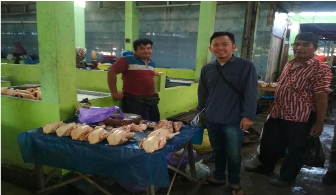
Setelah wawancara berakhir