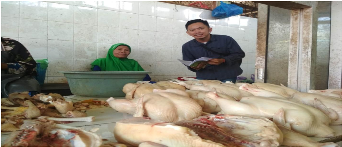
Saat wawancara berlangsung