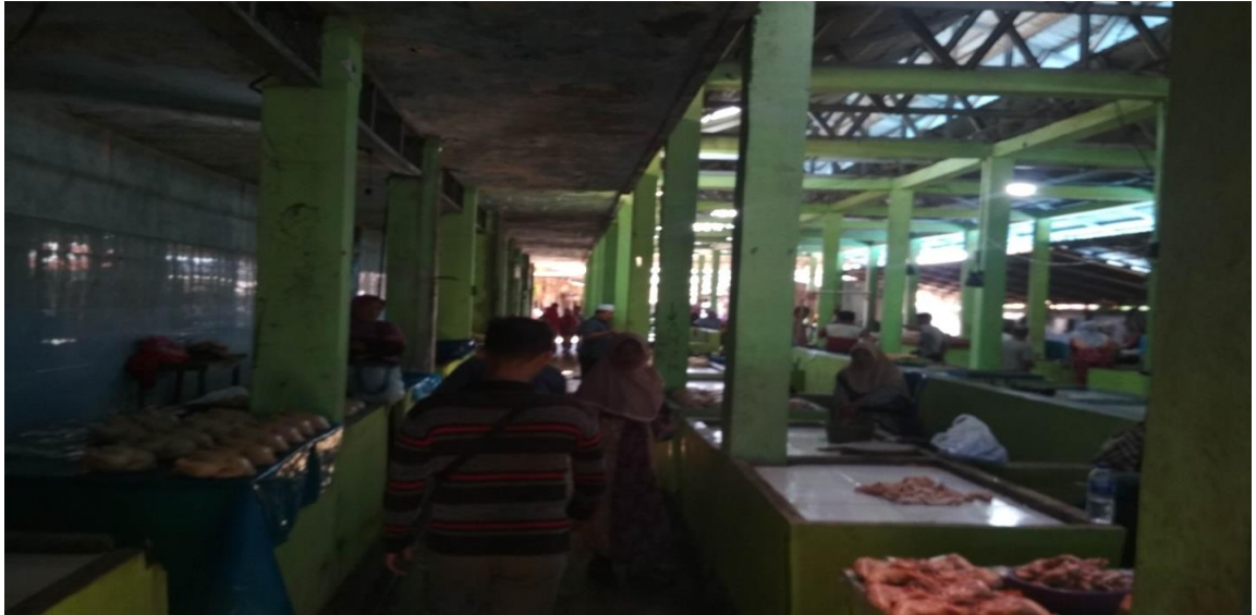
Lokasi ke 2 pedagang ayam potong dipasar keramat