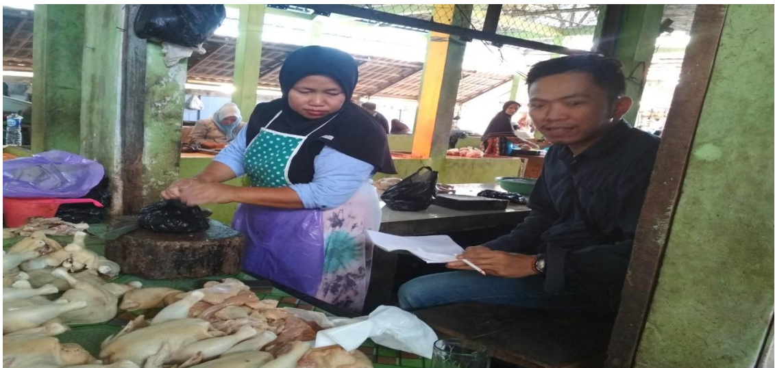
Proses wawancara berlangsung