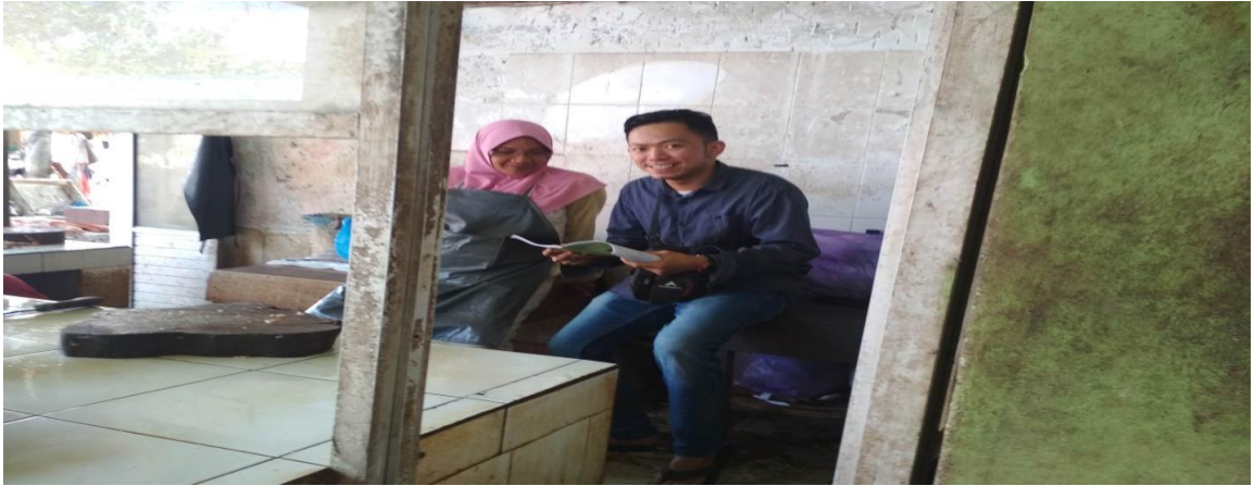
Proses wawancara berlangsung