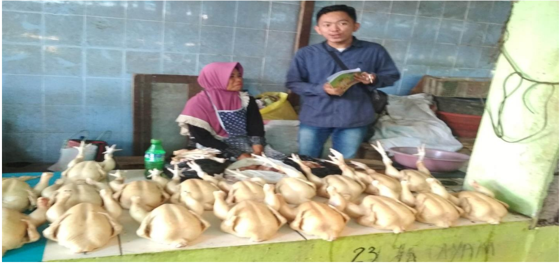
Saat wawancara berlangsung