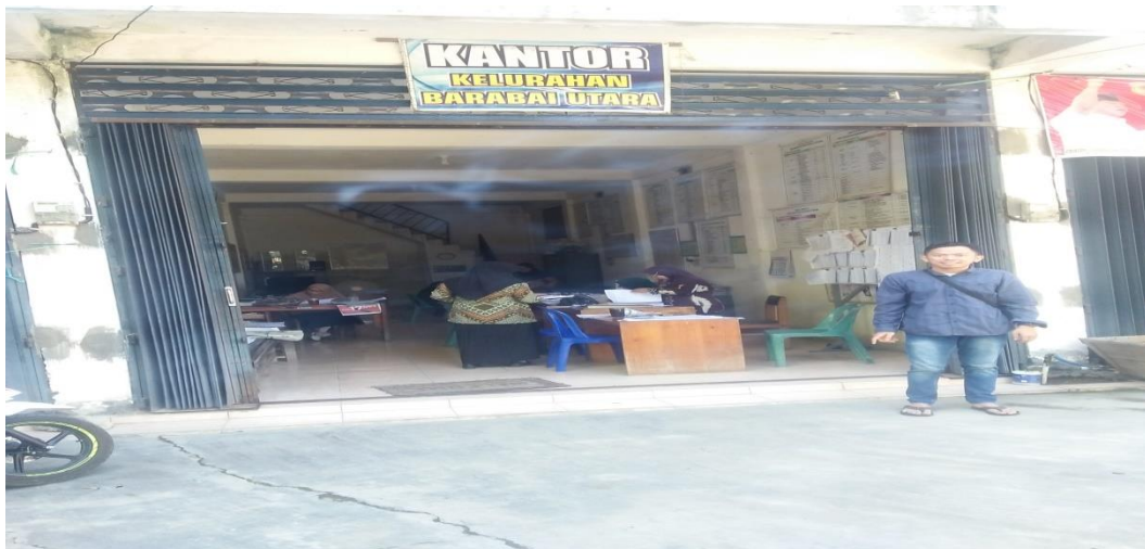
Lokasi kantor kelurahan Barabai Utara