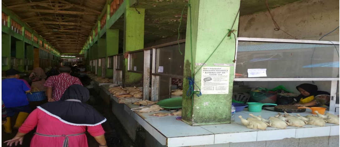
Lokasi ke 1 pedagang ayam potong dipasar keramat