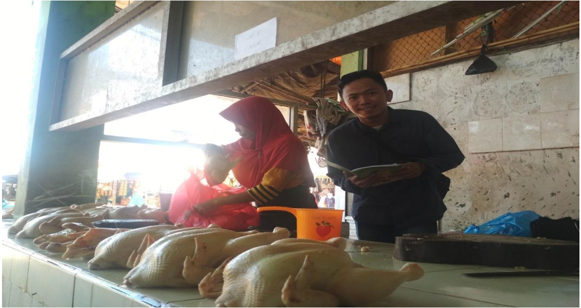
Saat wawancara berlangsung