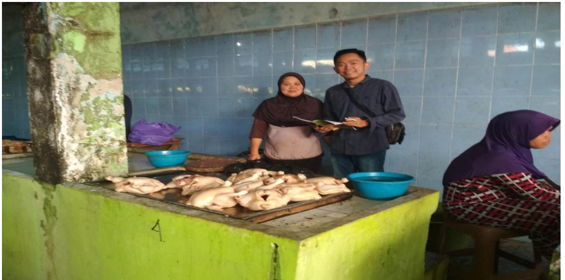
Foto bersama dengan responden setelah wawancara selesai