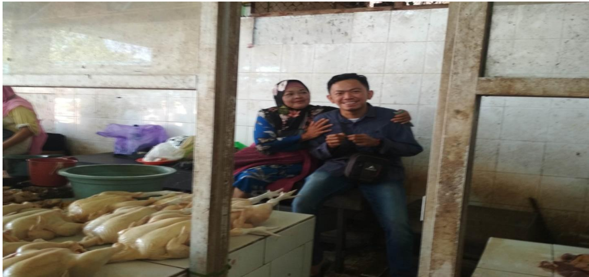
Wawancara dengan salah satu pedagang ayam potong