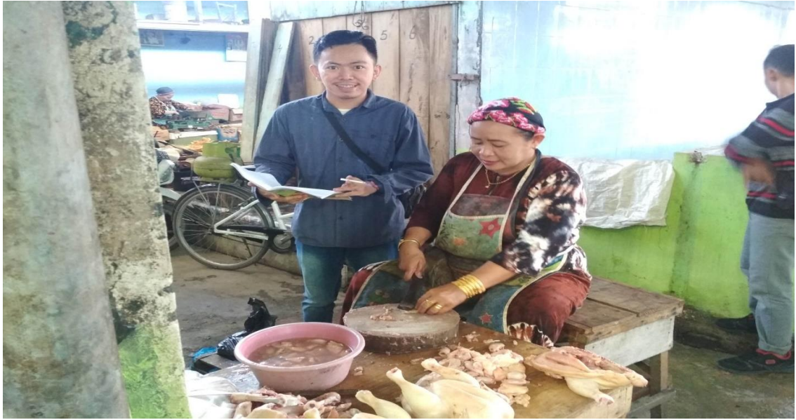
Saat wawancara berlangsung