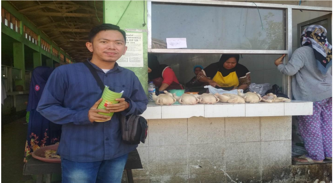
Setelah wawancara berakhir