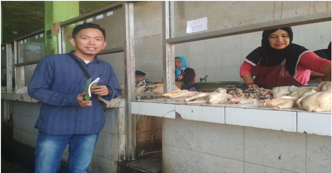
Saat wawancara berlangsung