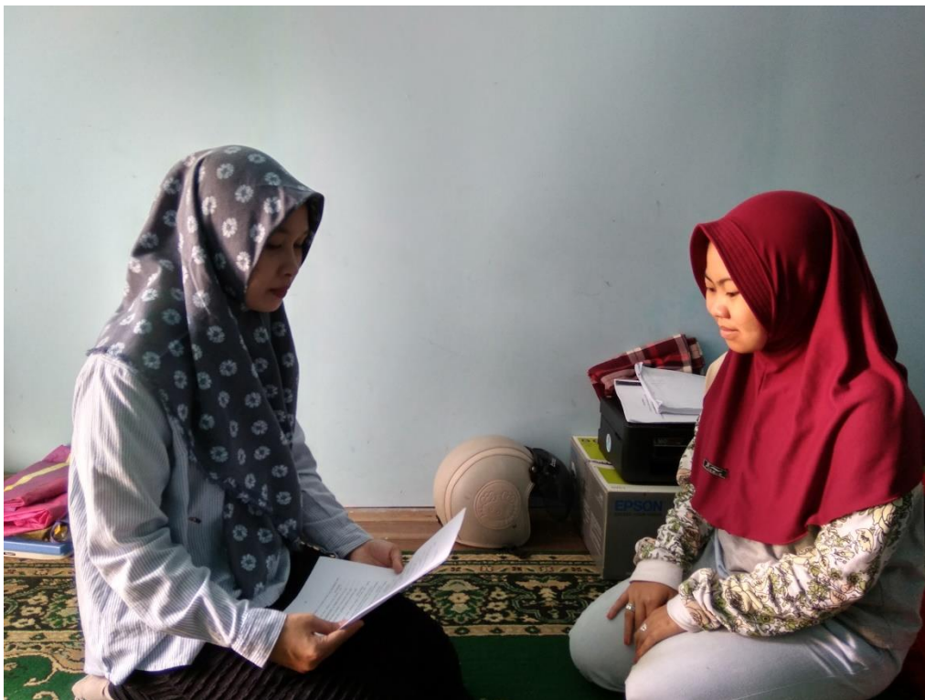
Dokumentasi Hasil Wawancara Kepada 2 Orang Nasabah Bank BRISyariah KC.Banjarmasin