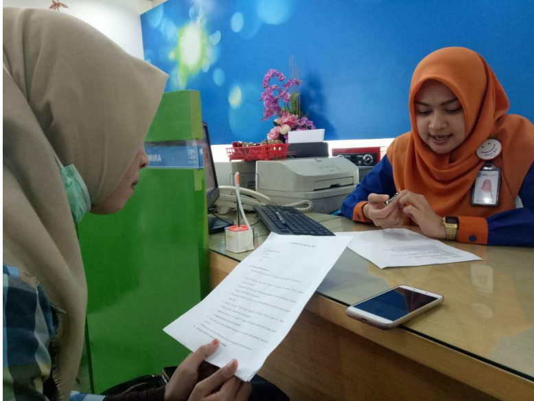
Dokumentasi Hasil Wawancara Pada Karyawan Customer Service PT. Bank BRIsyariah KC.Banjarmasin