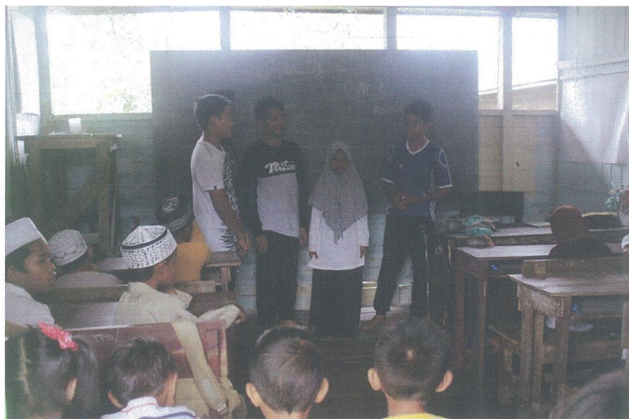
Kegiatan Pembelajaran Baca Tulis di Taman Baca Ar-Rayyan