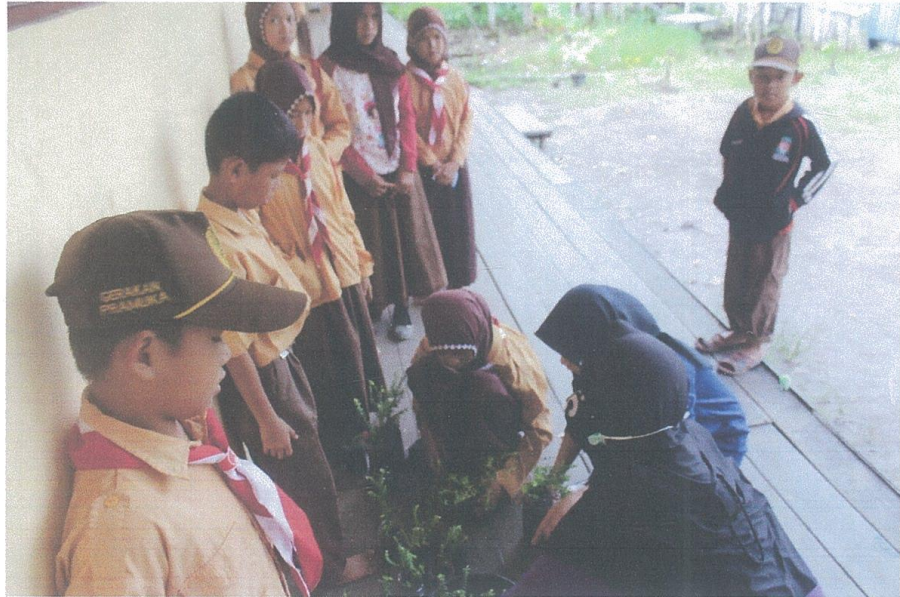
Kunjungan dengan Sekolah yang dekat dengan lokasi SMA GIBS Barito Kuala