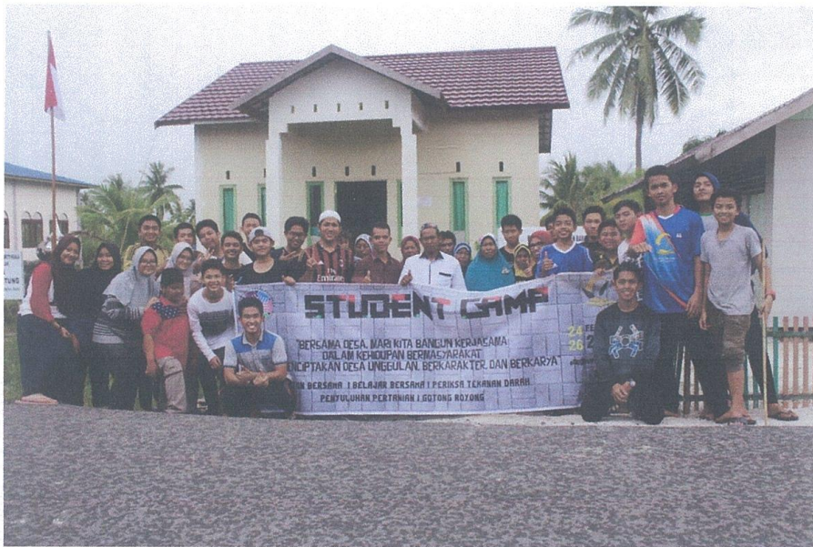
Pelaksanaan Kegiatan Student Camp di Rumah Penduduk