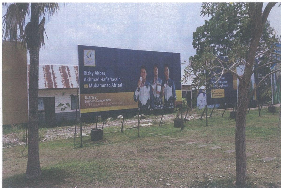
Baleho Hasil Prestasi Siswa yang di Pajang di halaman Sekolah