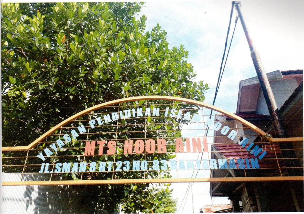
Fig. 1. Gate of MTS Noor Aini