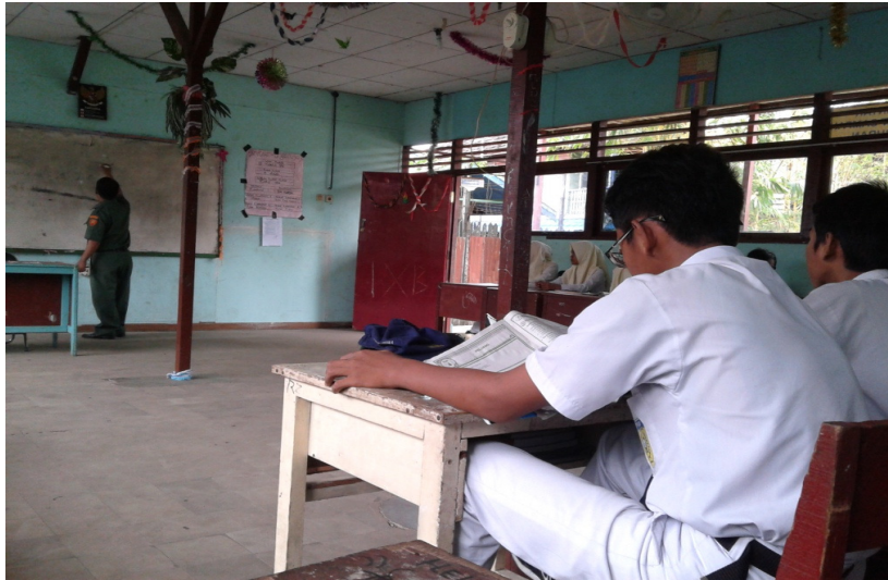
Gambar 1. 1. Kegiatan Pembelajaran Matematika Saat Observasi Awal

Mencermati kesenjangan di atas, berbagai upaya penyelesaian perlu dicari dan dilakukan agar kualitas proses pembelajaran dapat dipertahankan dan bahkan ditingkatkan. Menurut Winarno (2009:5) salah satu solusi pemecahan persoalan pembelajaran adalah penggunaan multimedia dalam pembelajaran. Alasannya adalah penggunaan multimedia dalam pembelajaran dapat memberikan dampak positif dan manfaat yang sangat luar biasa dalam memudahkan proses belajar siswa. Hasil penelitian dari Compu) menunjukkan bahwa seseorang hanya dapat mengingat apa yang dilihatnya sebesar 20%, 30% dari yang didengarnya, 50% dari yang didengar dan dilihatnya, dan 80% dari yang didengar, dilihat dan dikerjakannya secara simultan. Hal ini berarti bahwa penggunaan media, seperti multimedia pembelajaran berbasis komputer, memungkinkan siswa untuk meraih hasil belajar sebesar 80% dari yang dipelajarinya.