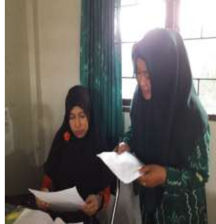
Wawancara dengan Guru MTsN 4 kota Banjarmasin