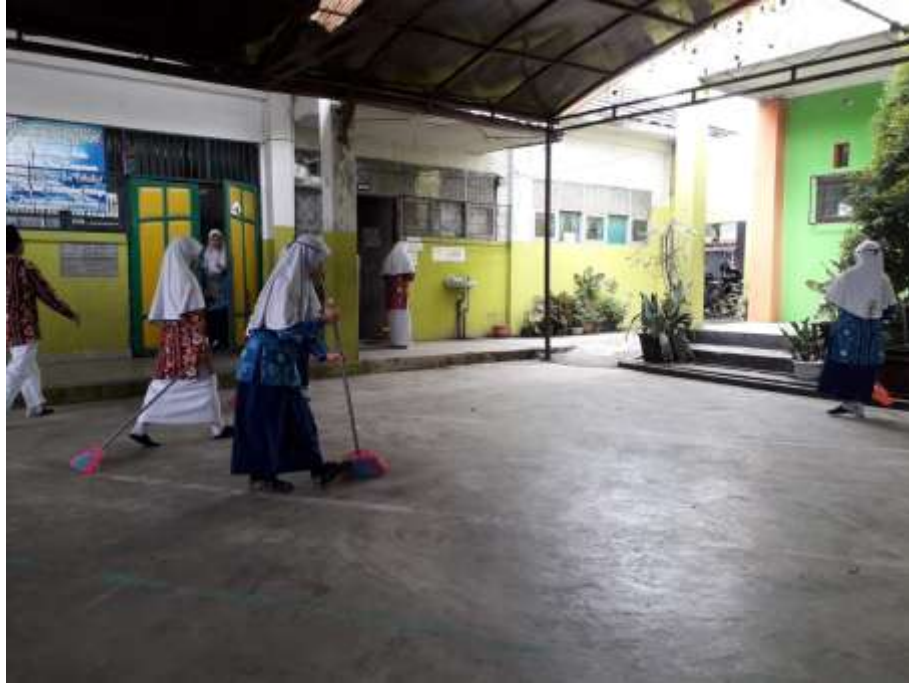
Kegiatan Pramuka dan Pmr