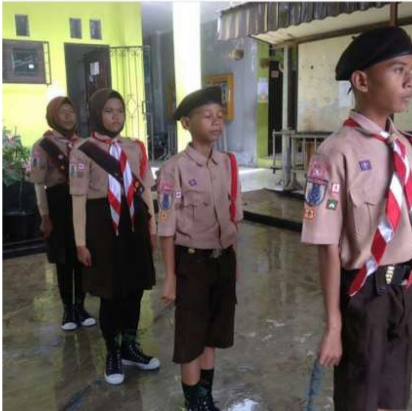
Kegiatan hari besar Islam