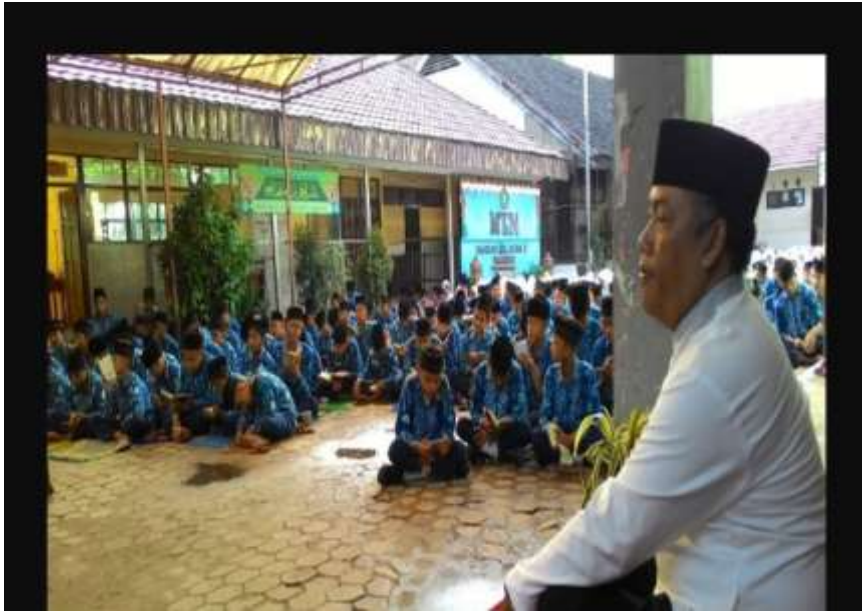
Kegiatan Shalat Dzohr bersama