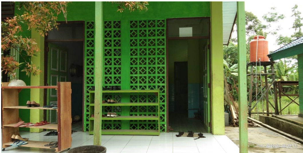
Gambar 7: Wc guru dan Siswa MIN 1 Barabai