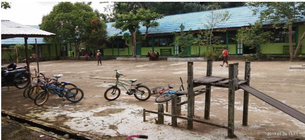
Gambar 1: Halaman sekolah MIN1 Barabai