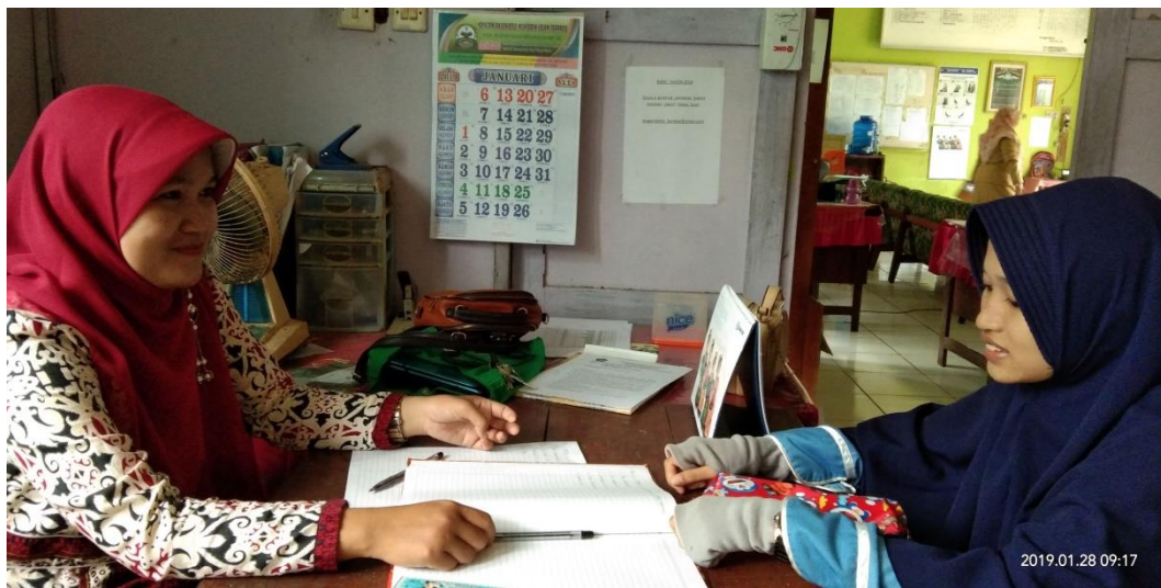
Gambar 11: Wawancara dengan petugas Tata Usaha MIN 1 Barabai