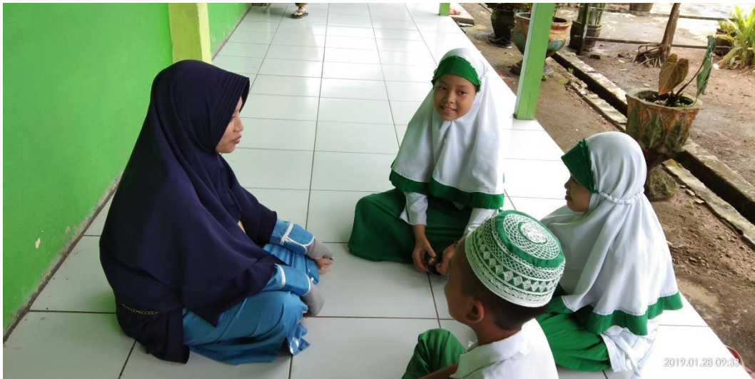
Gambar 12: Wawancara dengan murid kelas VI