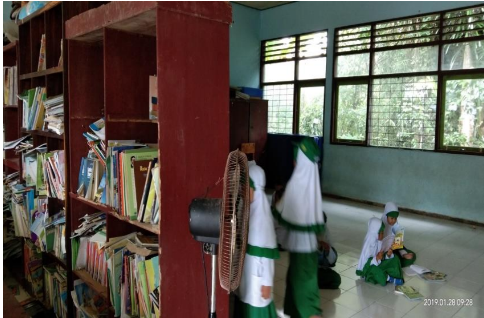
Gambar 2: Ruang Perpustakaan MIN 1 Barabai