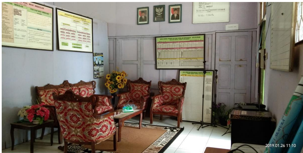
Gambar 3: ruangan kepala sekolah MIN 1 Barabai