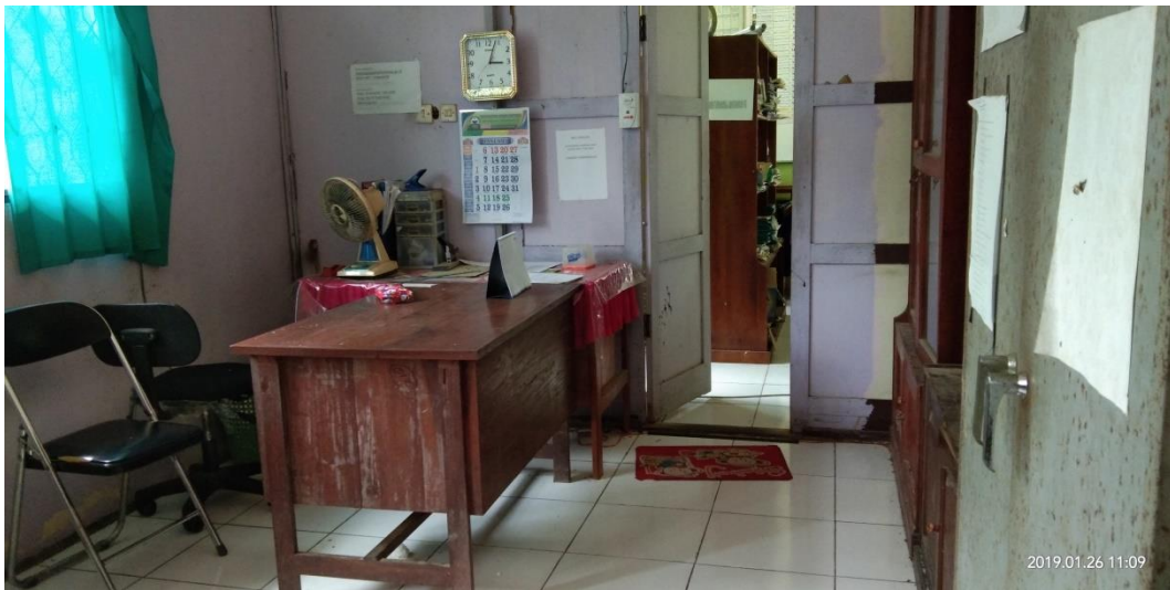
Gambar 5: Ruangan Tata Usaha MIN 1 Barabai