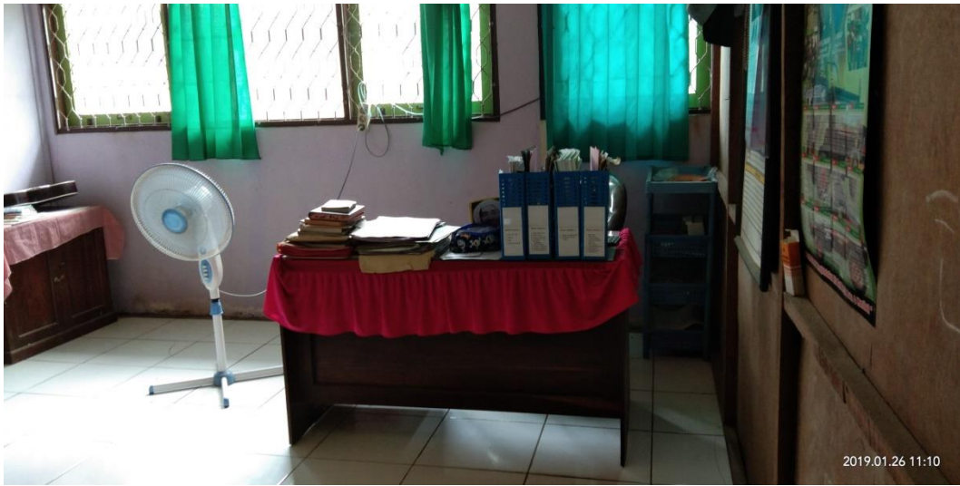
Gambar 4: Ruangan guru MIN 1 Barabai bagian muka dan di dalam