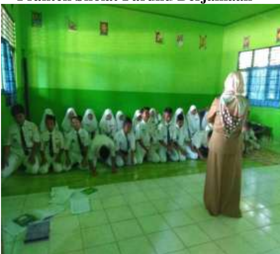
Praktek Sholat Fardhu Berjamaah