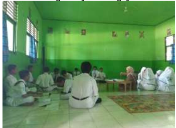
Sedang Belajar Mengajar