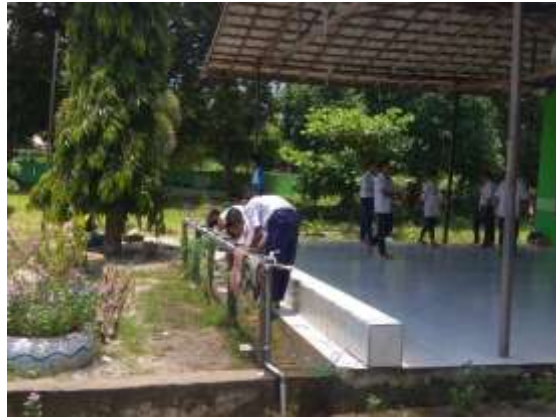
Peserta didik Melakukan Berwudhu