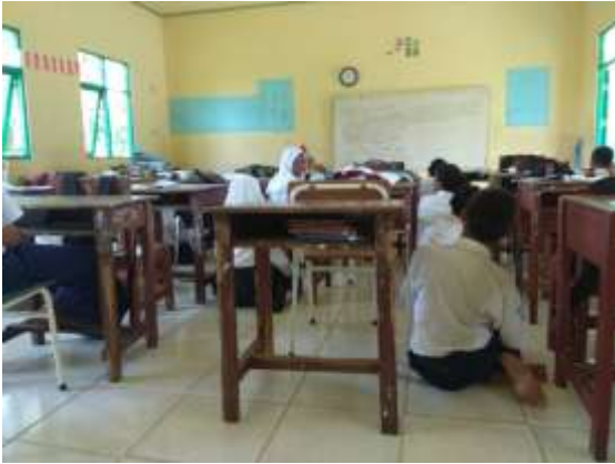
Peserta Didik Praktek Sholat