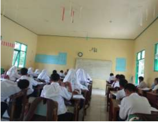
Guru Menjelaskan Materi Sholat