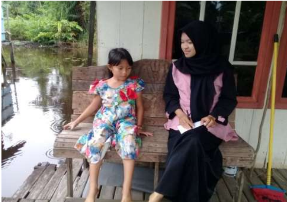
Wawancara dengan N anak ke tiga ibu R