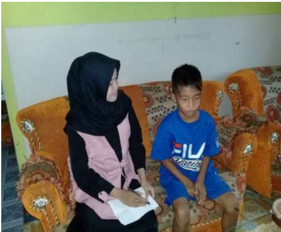
Wawancara dengan T anak ke dua ibu A