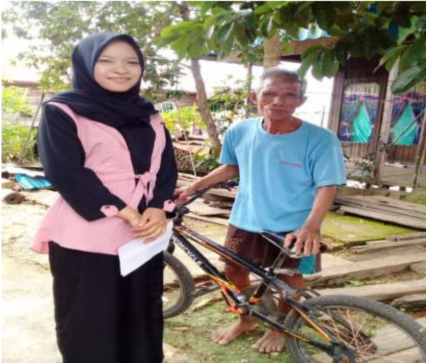
Wawancara dengan tokoh masyarakat