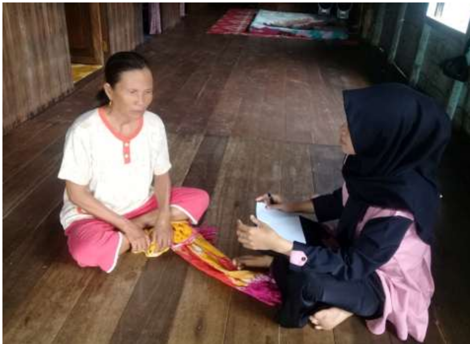
Wawancara dengan ibu B