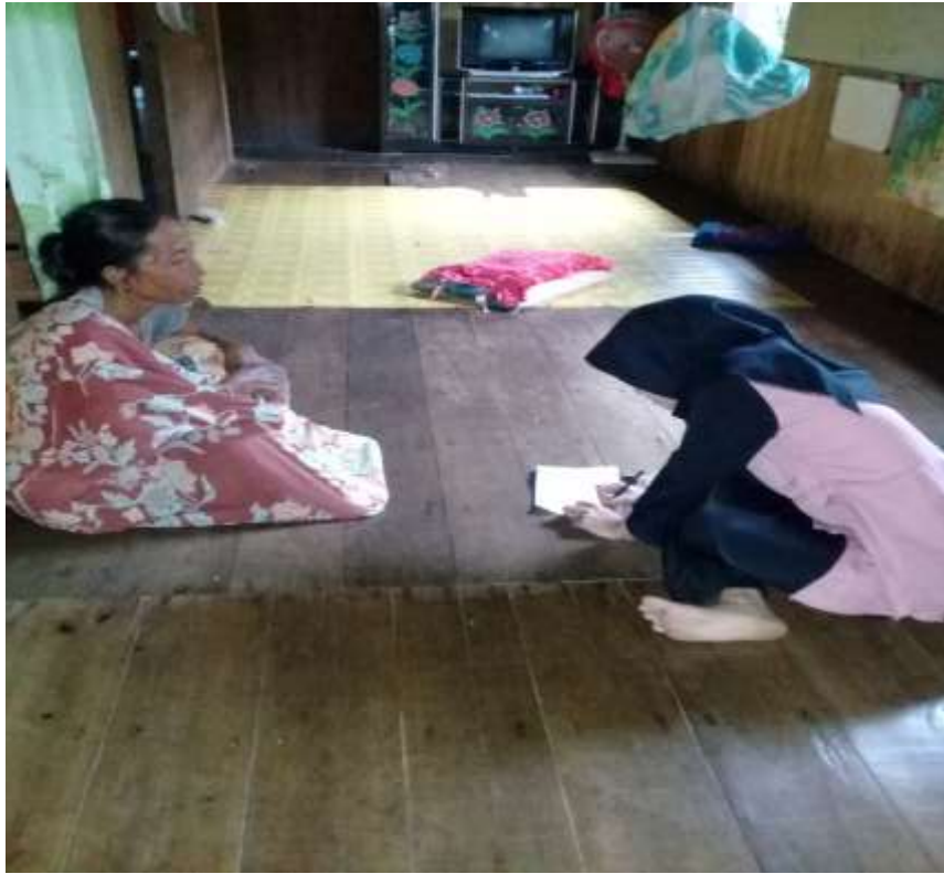
Wawancara dengan ibu A