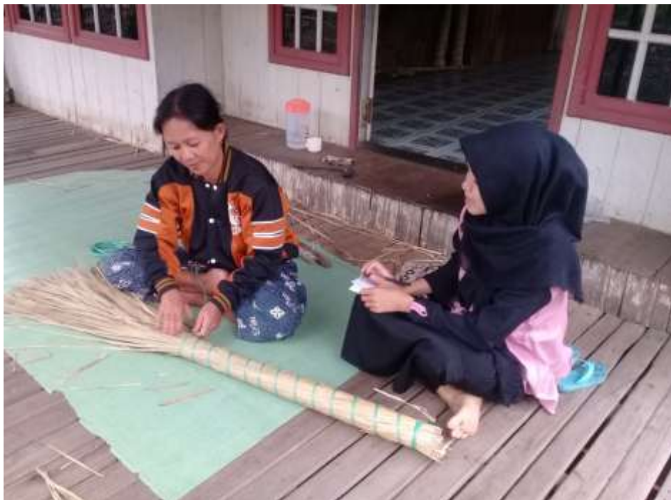
Wawancara dengan ibu R