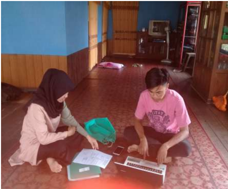
Meminta izin riset dengan SEKDES Desa Jambu