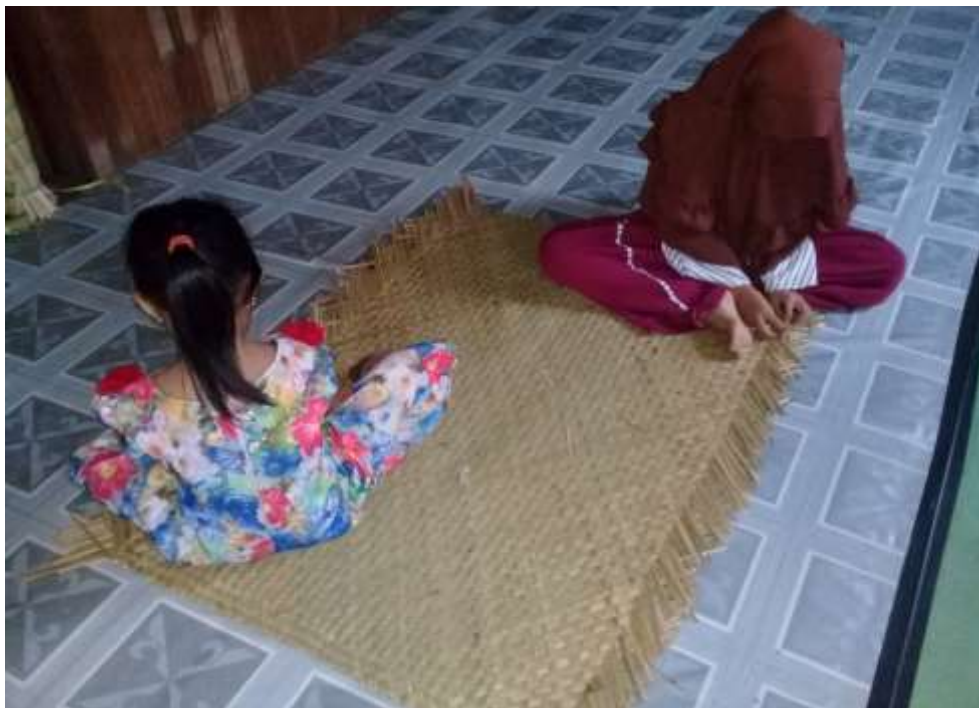
N membantu ibu R membuat kerajinan tikar