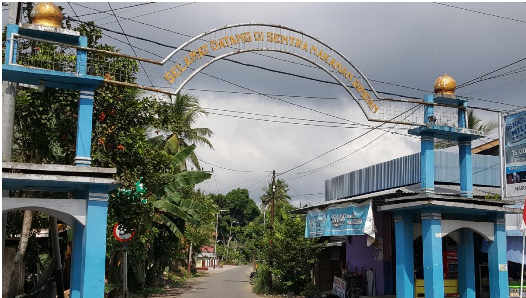
Foto Tempat Sentra Makanan Ringan Kota Kandangan