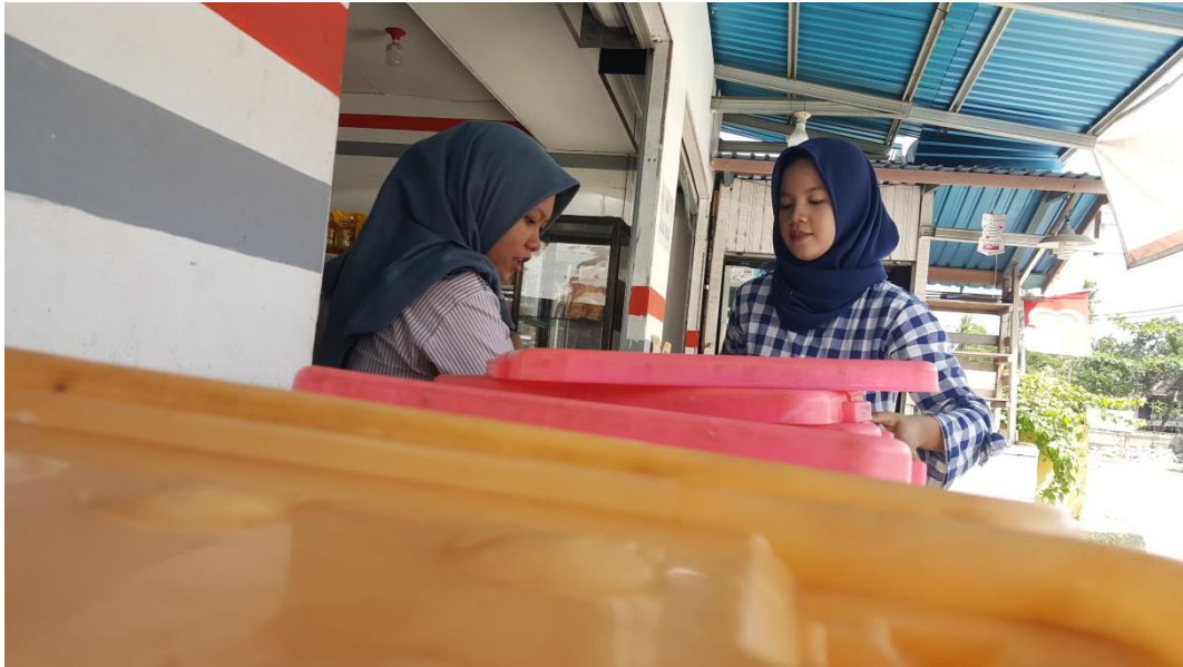
Wawancara dengan salah satu Informan