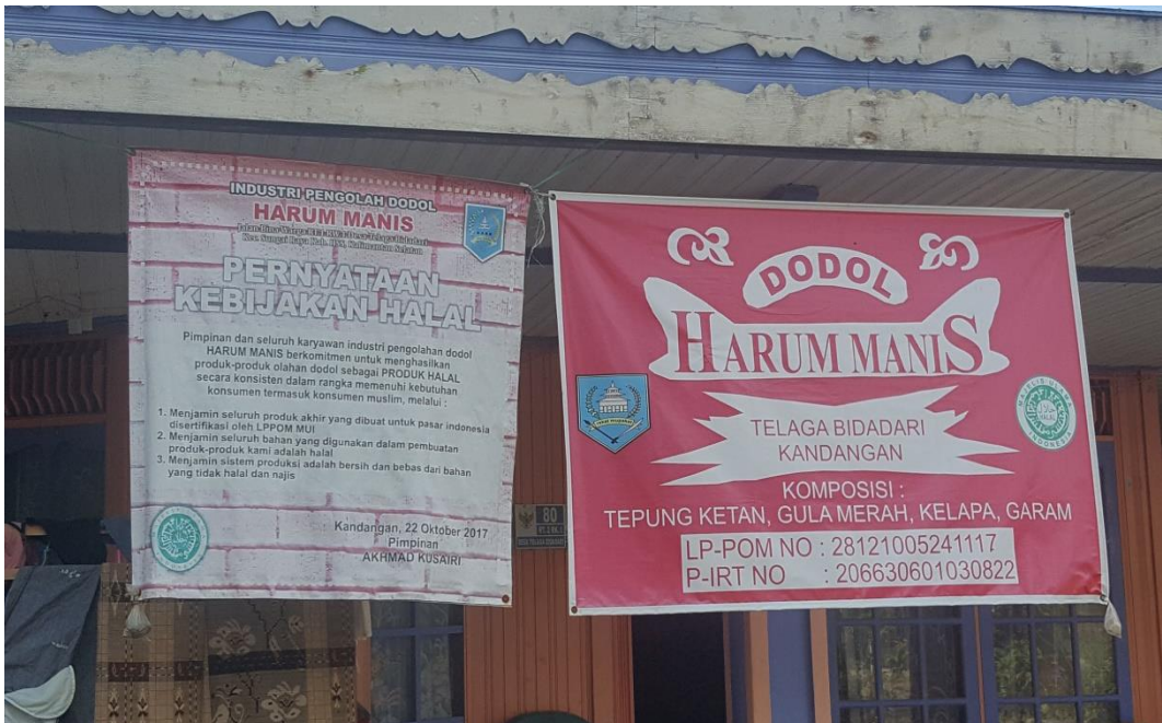
Foto Tempat Produksi Dodol Harum Manis