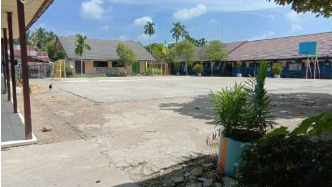
Lingkungan sekolah Madrasah Aliyah Negeri 3 Hulu Sungai Tengah