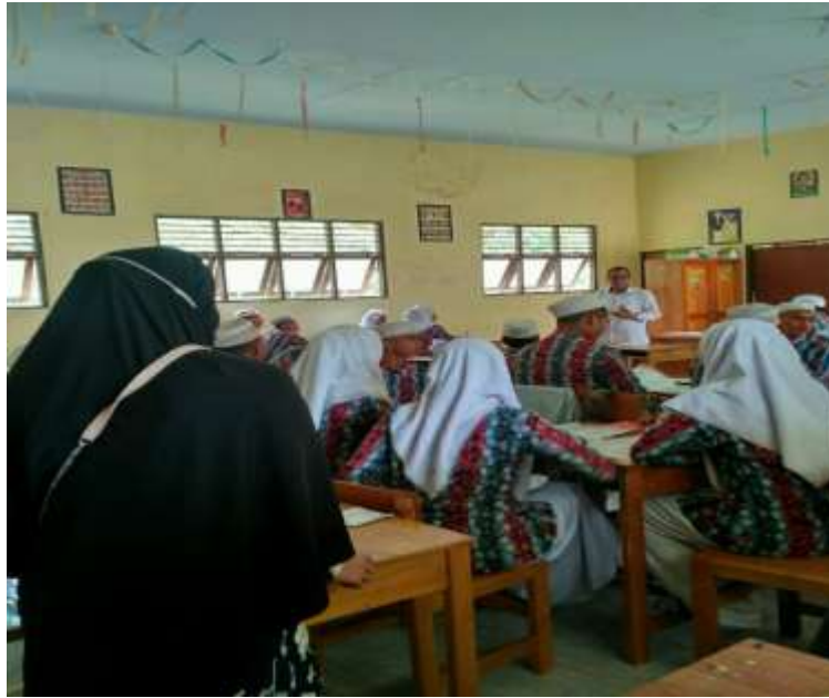
Gambar 3 Observasi saat pembelajaran berlangsung