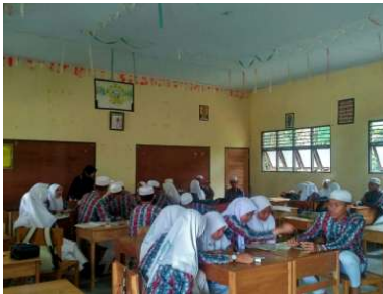
Gambar 2 Wawancara dengan Siswa kelas XI