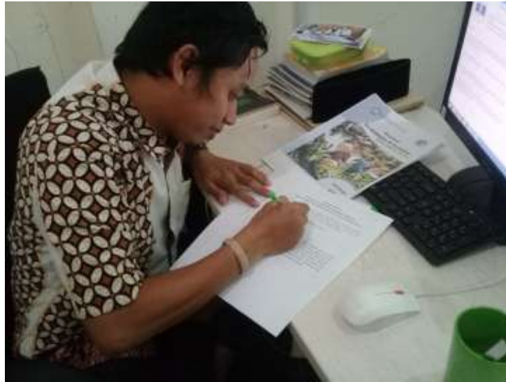
Gambar X Ahli Media