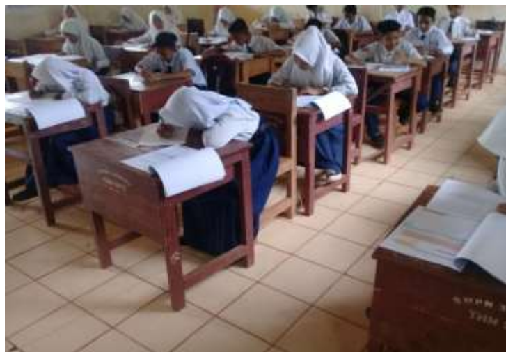
Gambar XII Uji Produk Respon Siswa