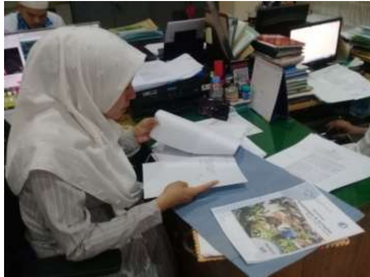
Gambar XI Ahli Bahasa