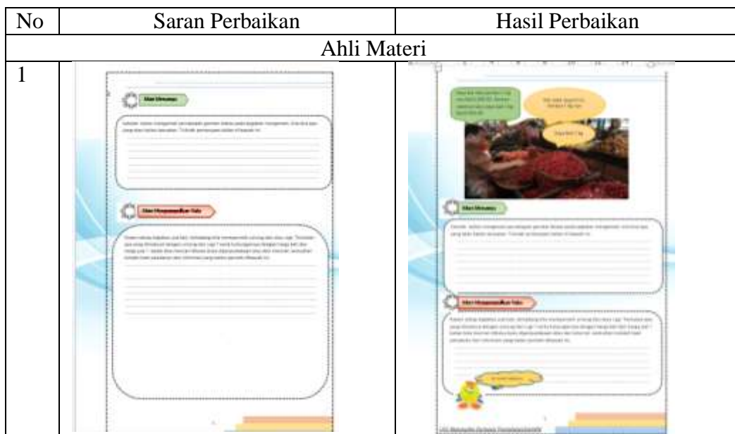
Tabel XI Hasil Revisi Desain pada Produk

Langkah selanjutnya ialah melaksanakan revisi produk sesuai arahan serta saran dari para ahli. Masukan serta hasil perbaikan oleh para ahli ialah: