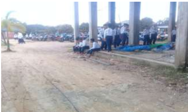
Beberapa siswa menunggu giliran melaksanakan shalat zuhur berjamaah