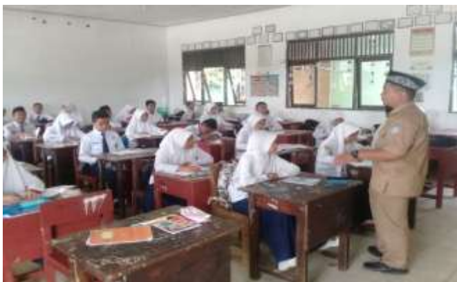
Proses bejar mengajar di kelas VIII A