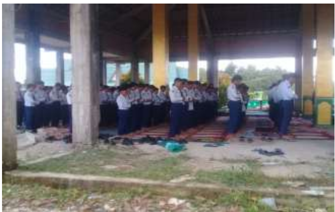
Pelaksanaan shalat zuhur berjamaah siswa-siswa