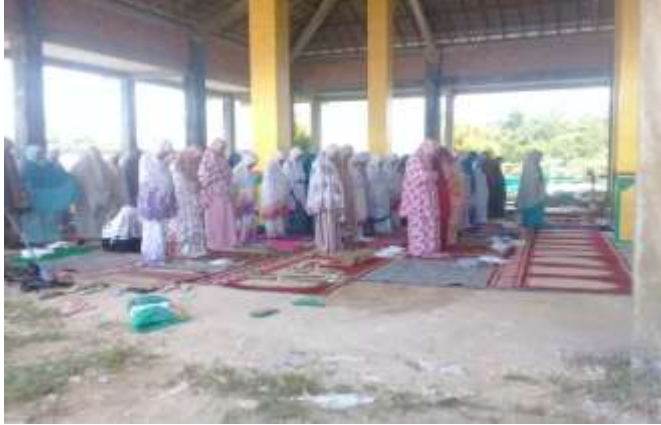
Pelaksanaan shalat zuhur berjamaah siswi-siswi