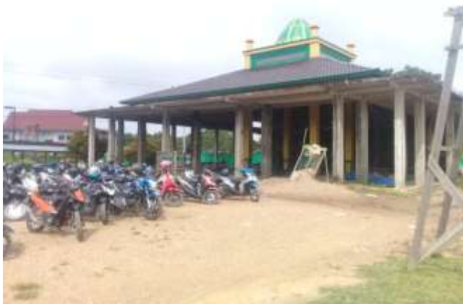
Mesjid Fa Firru Illallah