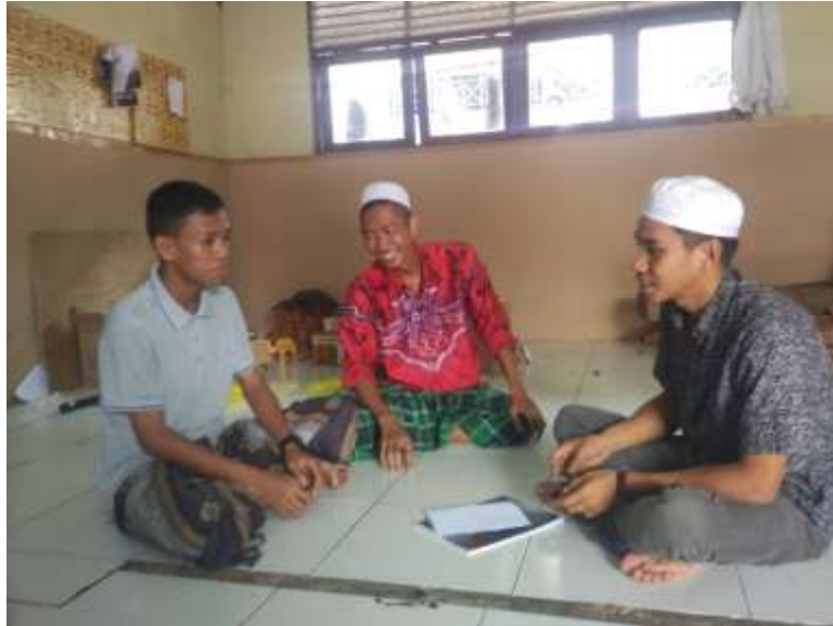
wawancara dengan santri bidang minat bakat IKPPF 2019