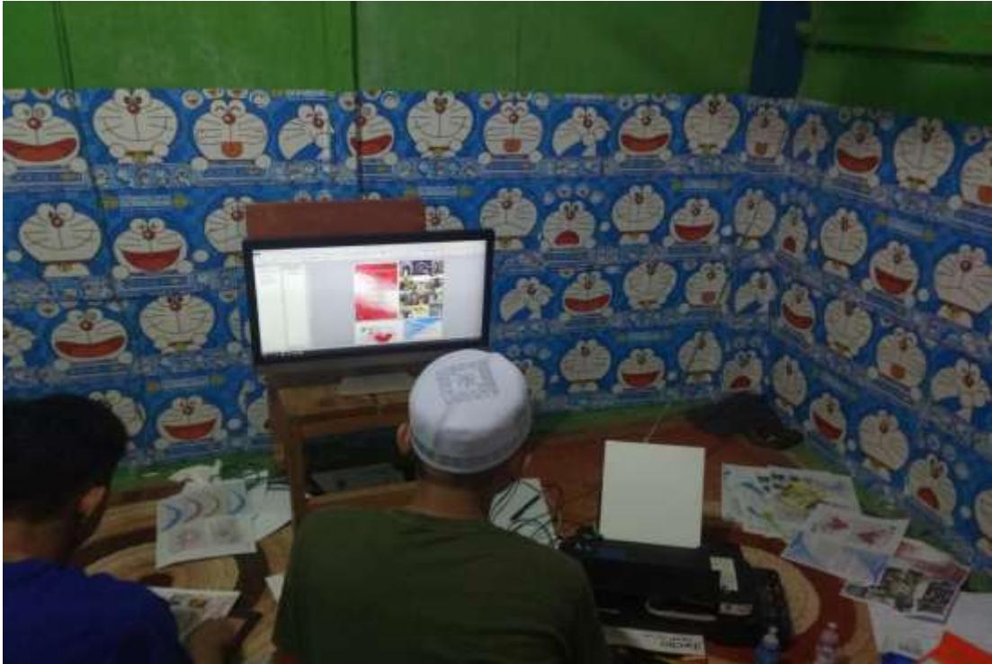
Proses percetakan Iflah