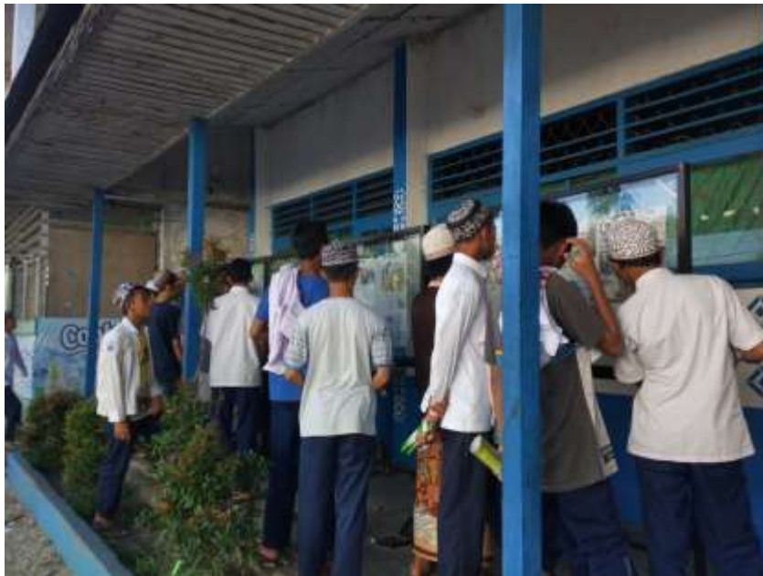
Gambaran minat baca santri Pondok Pesantren Al-Falah Putera Banjarbaru