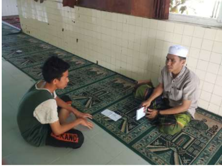
Wawancara dengan santri bidang minat bakat IKPPF 2019