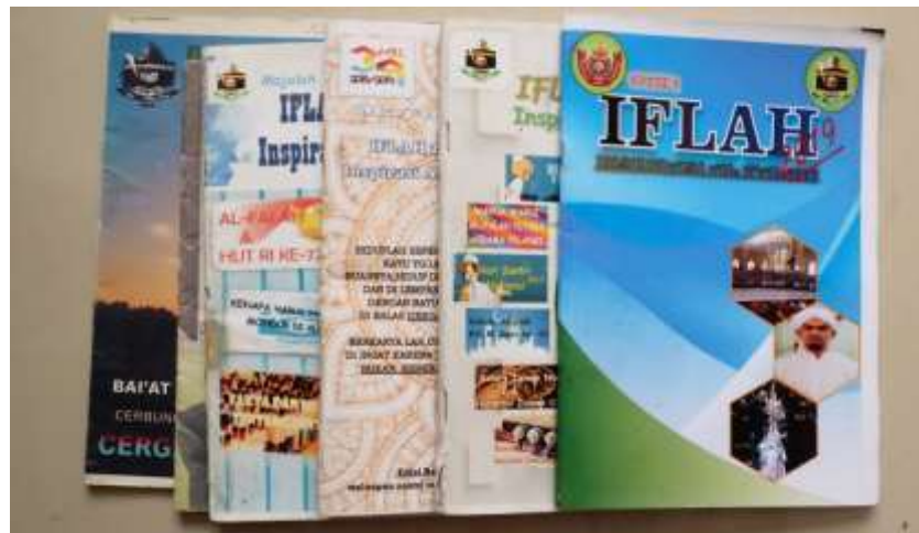
Gambar 4.1 Tampilan Majalah Iflah