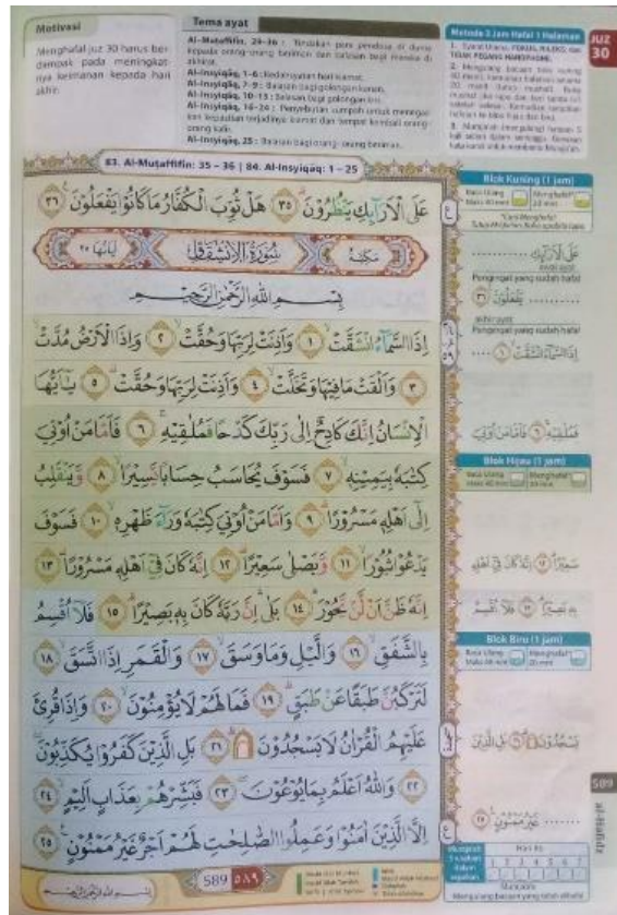
-المصحف "الحافظ للحفظ"-