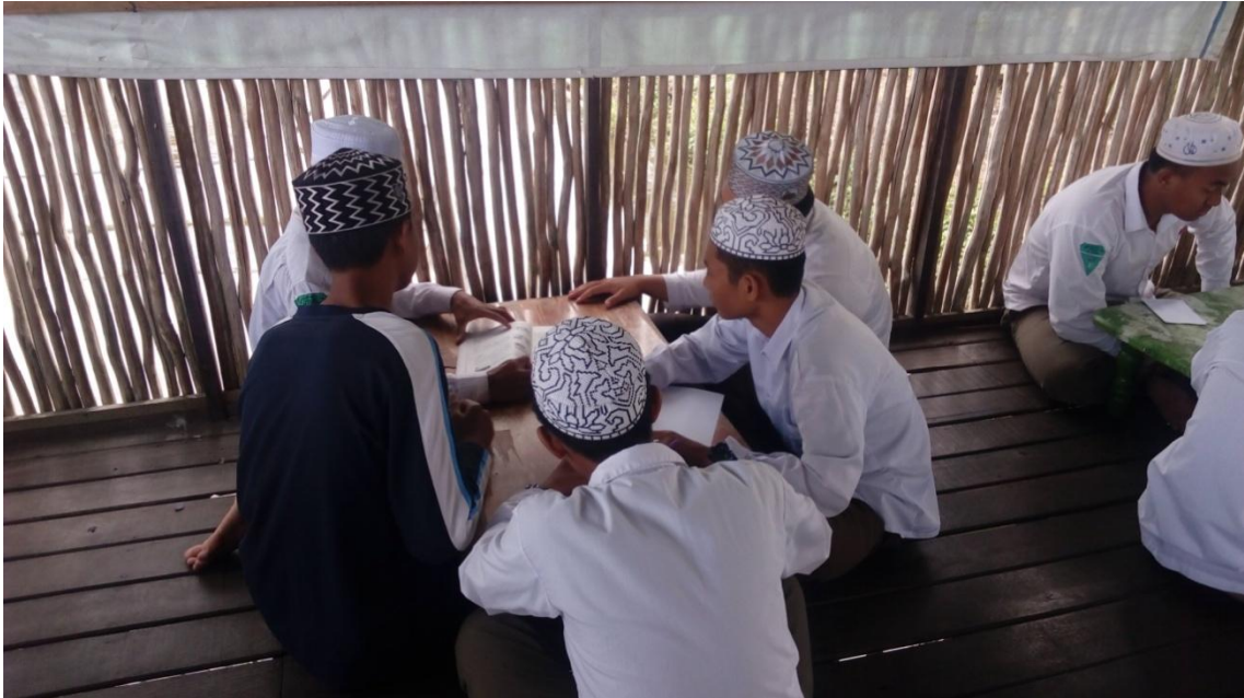
Gambar (7) Siswa secara berkelompok mempresentasikan hasil kerja kelompok