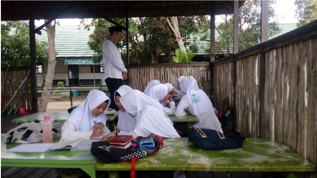
Gambar (5) Guru mengelompokkan siswa dan memberikan LKS untuk setiap kelompok