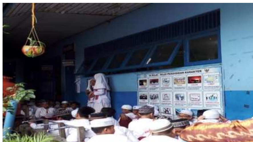
Gambar IV Taman Baca