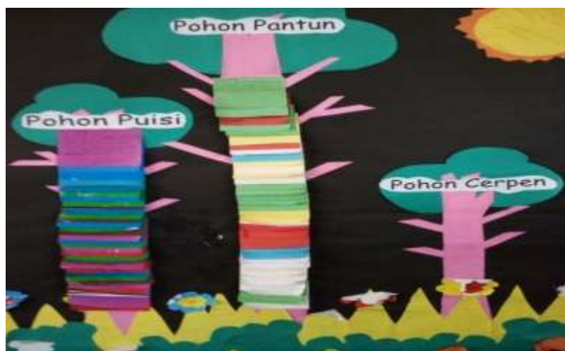
Gambar II Pohon Literasi

Kegiatan reading corner (dongeng literasi) dilakukan sebelum dilakukan pembelajaran di kelas sebagai sumber belajar. Kegiatan ini dilakukan setiap hari jum'at atau bisa disebut jum'at literasi. Semua anak dikumpulkan di depan kelas untuk melakukan kegitan tersebut. kemudian beberapa anak akan maju kedepan sesuai jadwal yang telah di berikan guru sebelumnya dengan membawakan sebuah cerita. cerita yang di sampaikan oleh siswa di reading corner (dongeng literasi) itulah yang di jadikan sumber belajar di kelas lima yang masih berkaitan materi tersebut dengan cerita di sampaikan dalam pembelajaran.