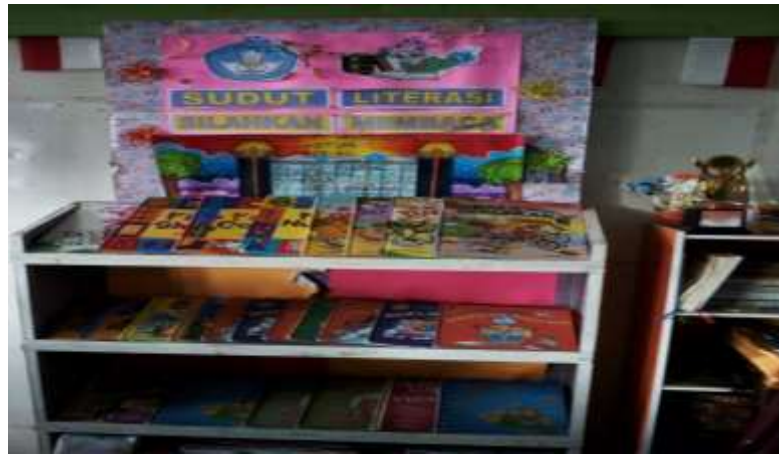
Gambar III Sudut Literasi