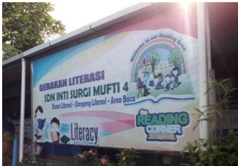
Gambar I Reading Corner

Reading corner berasal dari bahasa Inggris read yang berarti membaca. Sesuai dengan namanya reading corner ini awalnya dibuat untuk meningkatkan baca anak yang sudah menurun dari tahun ketahun sejak dini dengan program GLS (gerakan literasi sekolah) di SDN Inti Surgi Mufti 4 Banjarmasin. Reading corner di SDN Inti Surgi Mufti 4 Banjarmasin di dirikan sekitar tahun 2014 yang pada waktu itu SDN Inti Surgi Mufti 4 Banjarmasin di kepalai oleh ibu Yuni Candra Dewi yang terinspirasi dari sekolah-sekolah di luar kalimatan yang lebih dulu merapkan GLS (gerakan literasi sekolah) sebagai program sekolah. Selain itu GLS (gerakan literasi sekolah) memperkuat gerakan penumbuhan budi pekerti dituangkan dalam peraturan menteri pendidikan dan kebudayaan nomor 23 tahun 2015 tentang pertumbuhan budi pekerti.