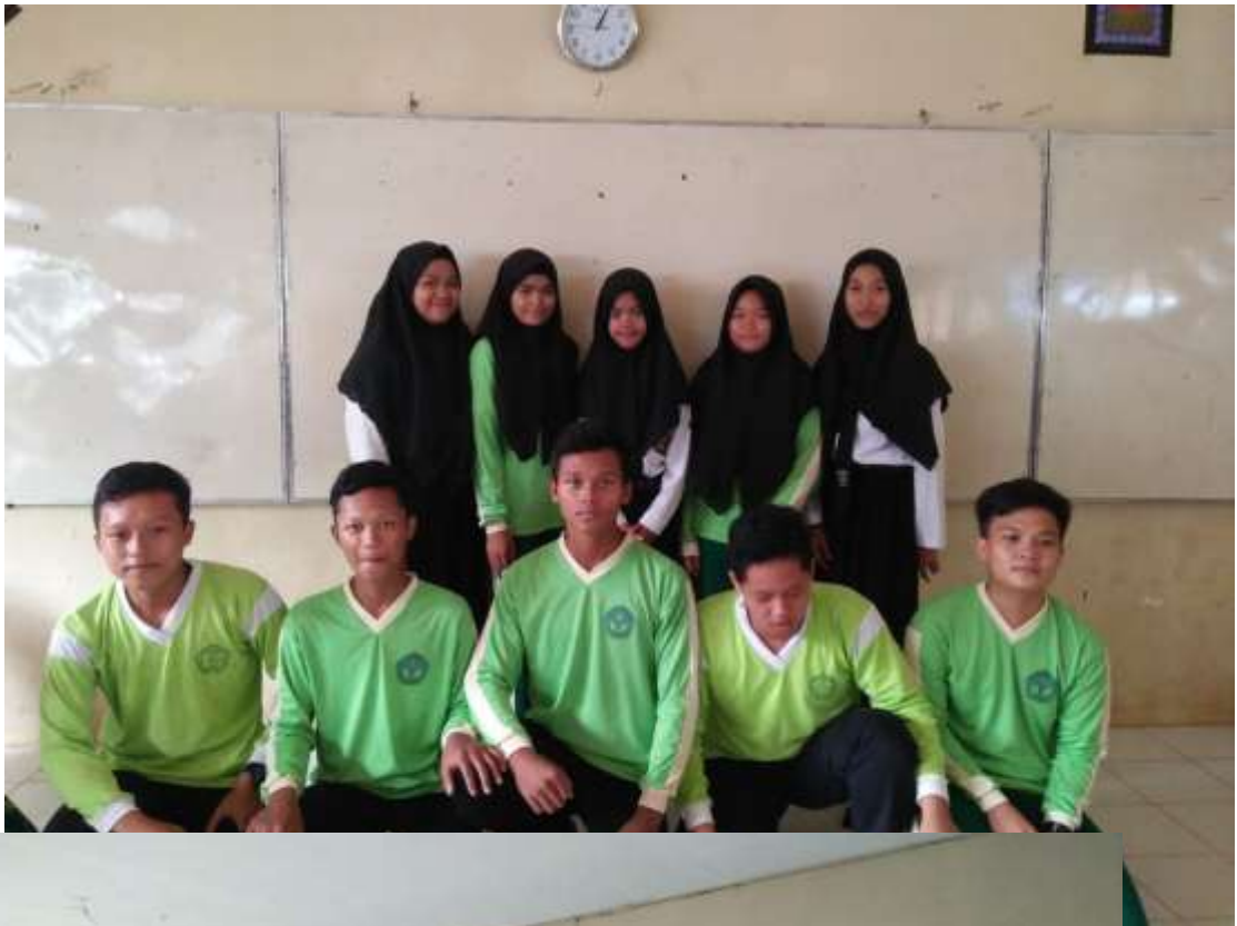
Foto Waktu Pembagian Angket