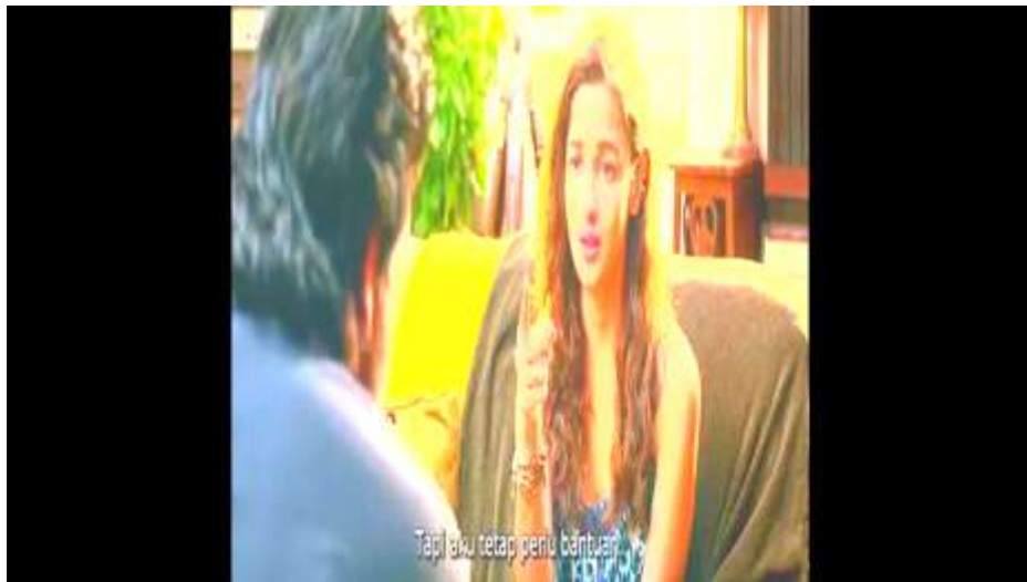
Gambar III (Proses Konseling Tahap Akhir)

Ko: Kamu tahu. Dimasa kecil, yang lebih tua bilang 'jangan menagis'. Saat kita marah mereka bilang 'tersenyumlah'. Kau tau alasannya? Agar rumah tetap damai. Saat kita ingin membenci, mereka tak mengizinkannya. Jadi sekarang, saat ingin mencintai tiba-tiba sistem emosional kita jadi kacau balau tak berfungsi lagi. Kesedihan, amarah, kebencian tak bisa kita ungkapkan. Jadi sekarang, bagaimana cara ungkapkan rasa cinta? Terkadang marah tak jadi masalah, bahkan pada orang tua. Itu bagus, menyetatkan. Tak masalah, Kaira.