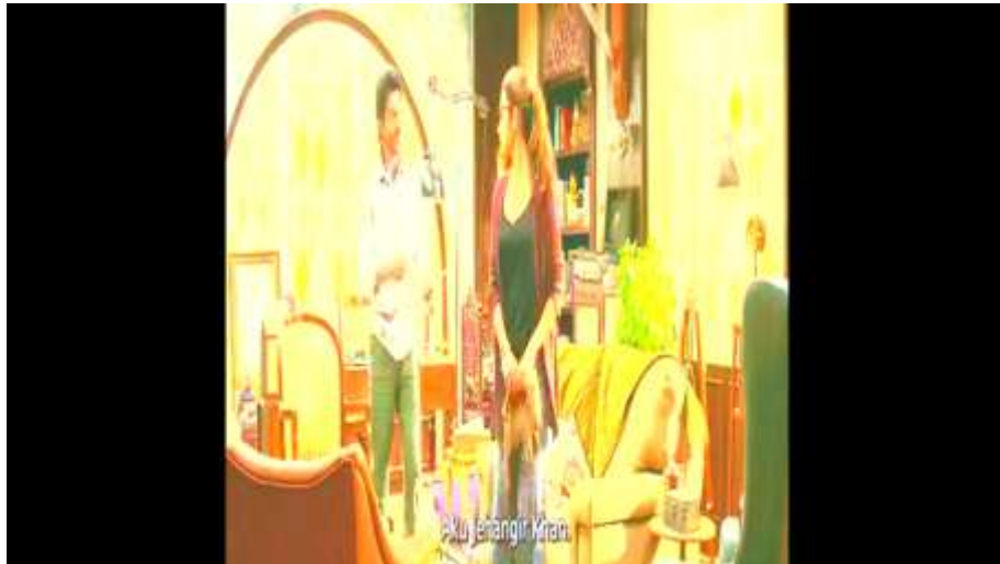
Gambar I (Pelaksanaan Konseling Tahap Awal)