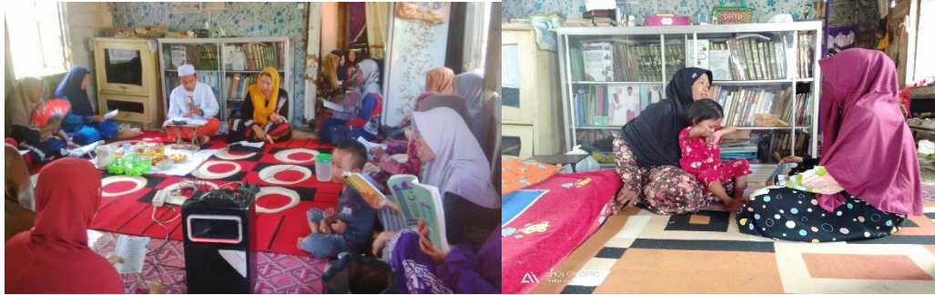
Kegiatan Yasinan Mingguan dan Pembacaan Manaqib Wawancara dengan Guru ngaji