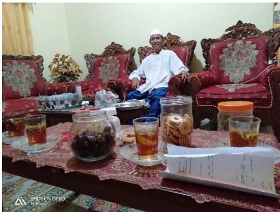
Wawancara dengan Tokoh Masyarakat