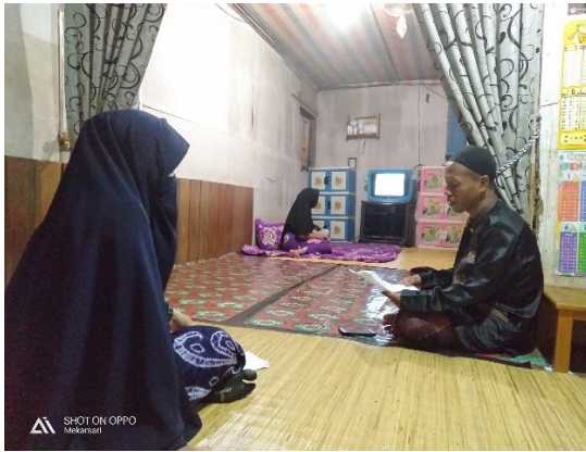
Wawancara dengan Tokoh Agama