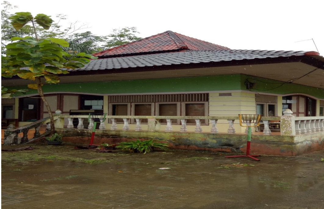
GEDUNG BELAJAR PON-PES