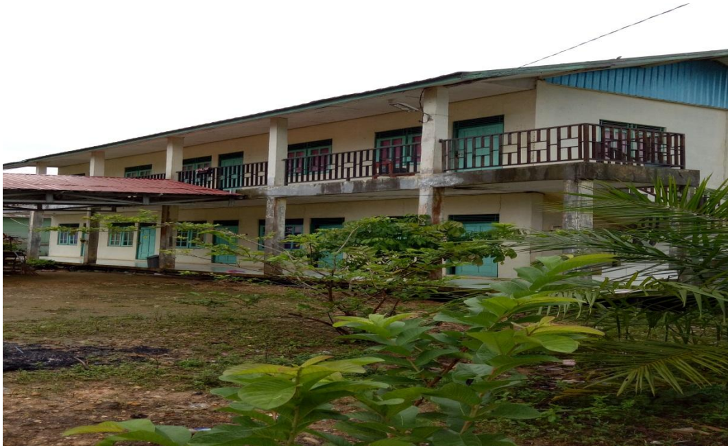
GEDUNG ASRAMA PUTR12 PONDOK PESANTREN USHULUDDIN