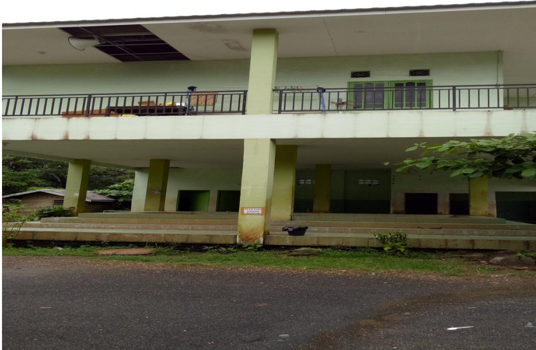
HALAMAN PON-PES DI DEPAN KANTIN MAKAN