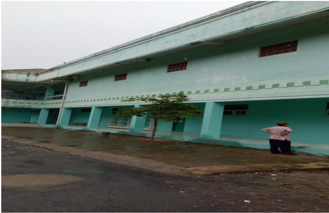
GEDUNG ASRAMA PUTRA 2 PONDOK PESANTREN USHULUDDIN