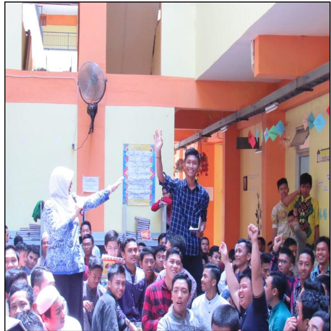
Kegiatan Success Story Putera