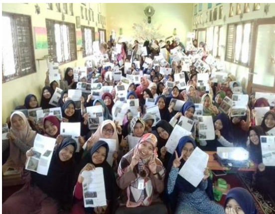
Kegiatan Setting Goal Puteri