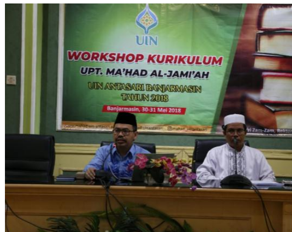
Workshop Kurikulum Ma'had al-Jami'ah Dihadiri Rektor UIN Antasari serta wakil rektor, Mudir, Murabbi/ah dan Musyrif/ah