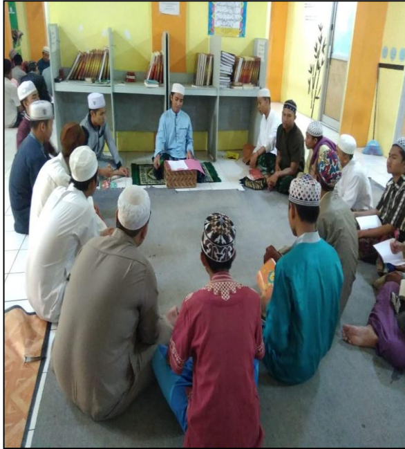
FOTO-FOTO KEGIATAN MA'HAD AL-JAMI'AH