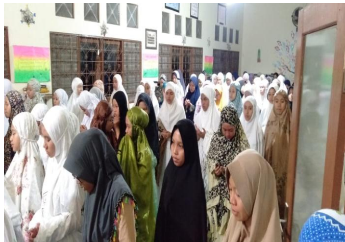
Kegiatan Maulid Habsyi