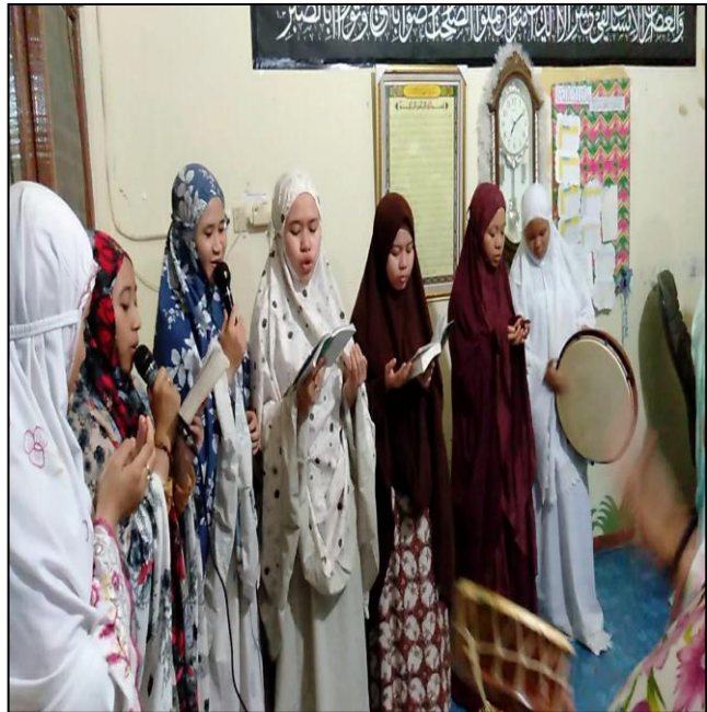
Kegiatan Maulid Habsyi