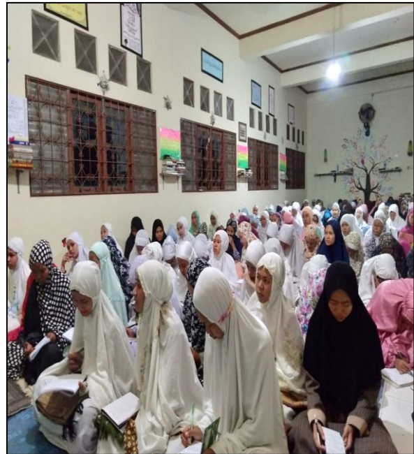
Kegiatan Tausiah Agama 3x Seminggu (Materi Tauhid, Fiqih, Akhlak/Tasawuf