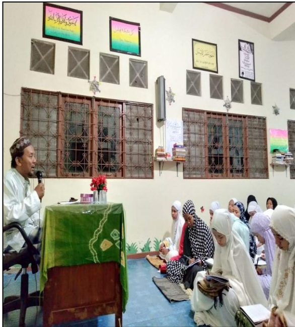
Kegiatan Tausiah Agama 3x Seminggu (Materi Tauhid, Fiqih, Akhlak/Tasawuf