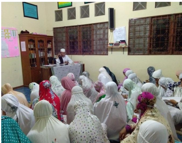
Kegiatan Tausiah Agama