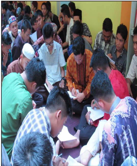
Kegiatan Goals Setting Putera