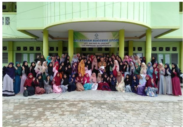
Kegiatan Success Story Putera