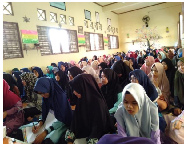
Kegiatan Tausiah Agama