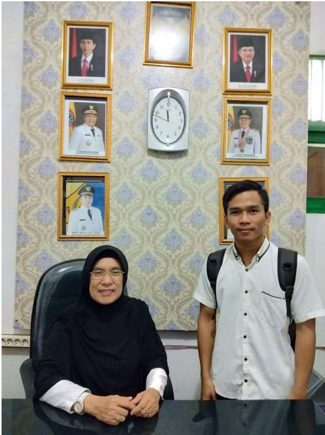
Wawancara dengan kepala Sekolah