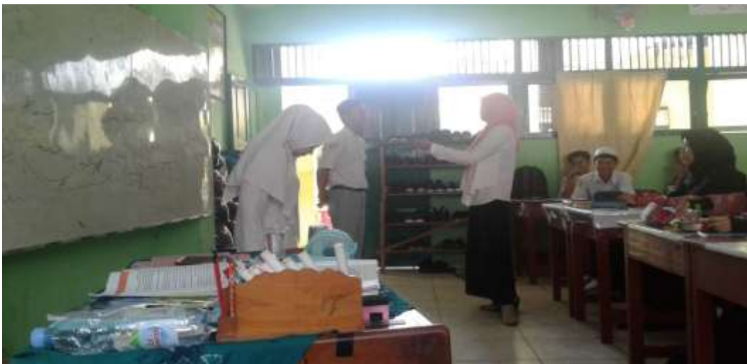
Kegiatan Pembelajaran di kelas XI IIS 2