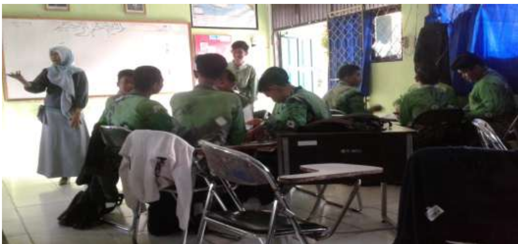
Kegiatan Pembelajaran di kelas XI 1