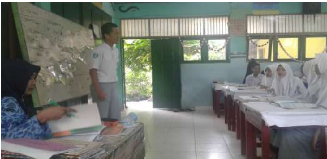
Kegiatan Pembelajaran di kelas XI IIS 1