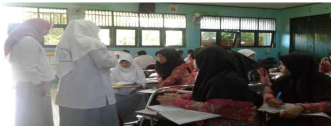
Kegiatan Pembelajaran di kelas XI IIS 2