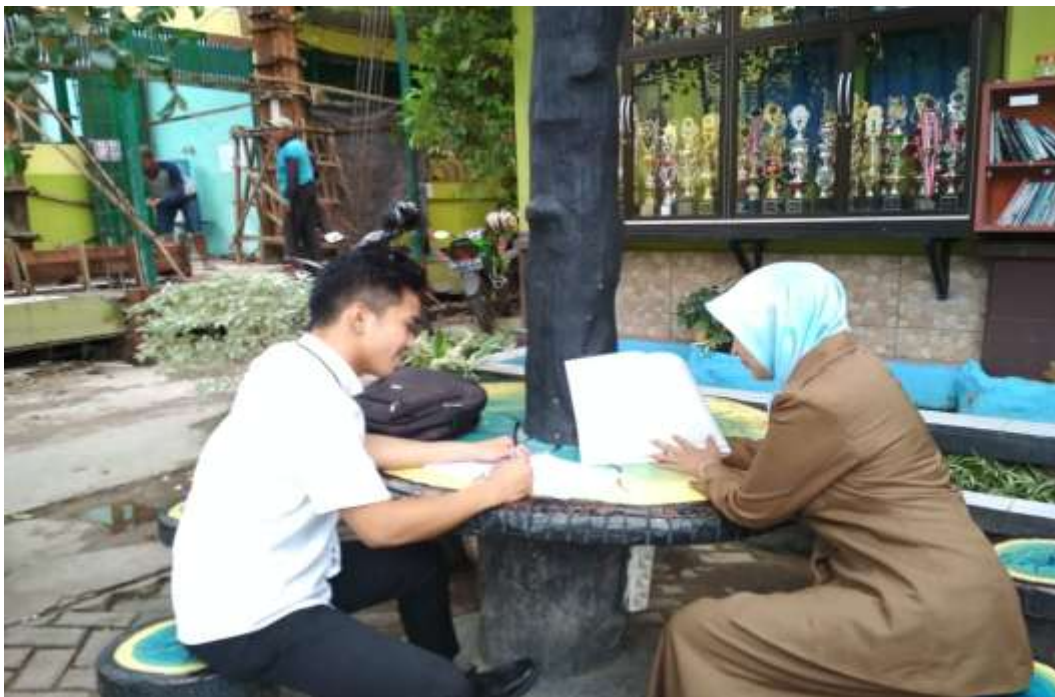
Wawancara dengan Guru Sejarah Kebudayaan Islam