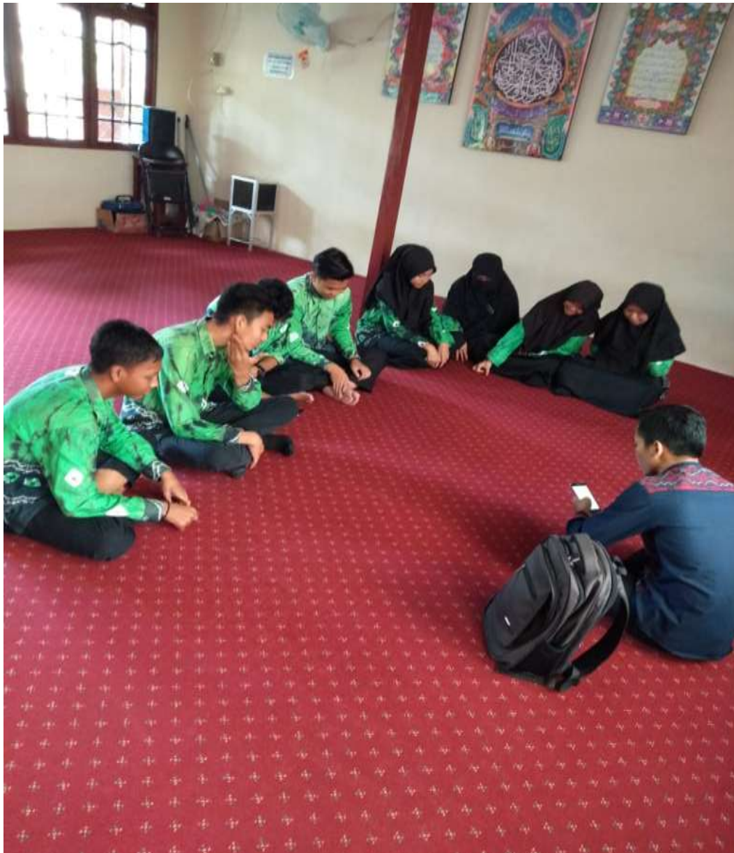
Wawancara dengan siswa-siswi di MAN 3 Banjarmasin