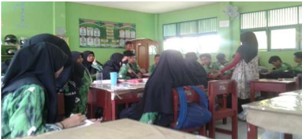
Kegiatan Pembelajaran di kelas X MIA 1