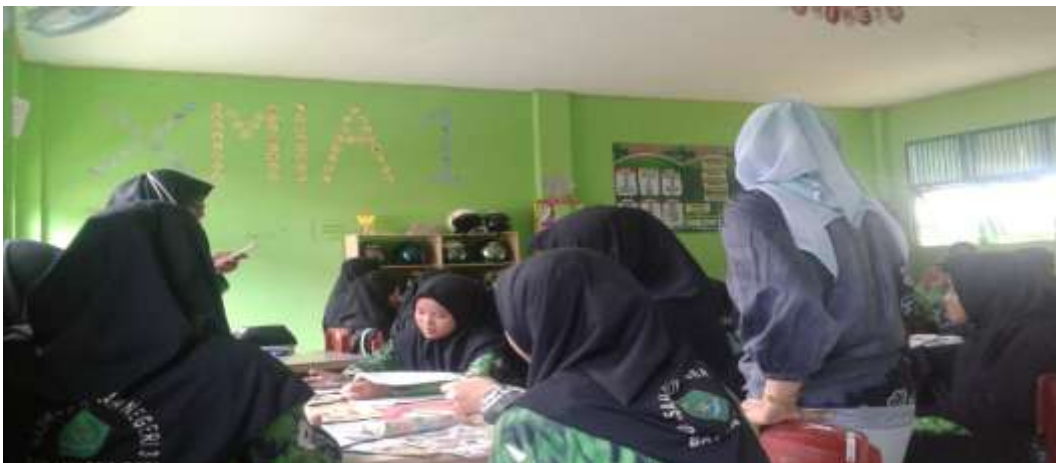
Kegiatan Pembelajaran di kelas X mia 1