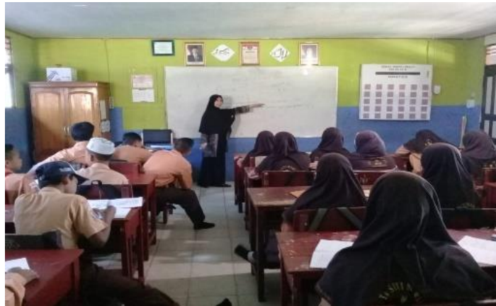
Gambar VI. Aktivitas membuat kesimpulan

Siswa menyampaikan hasil diskusi kelompok mereka, lalu guru bersama-sama siswa membuat kesimpulan dari hasil percobaan. Siswa diberi kesempatan untuk menanyakan materi yang belum dipahami.