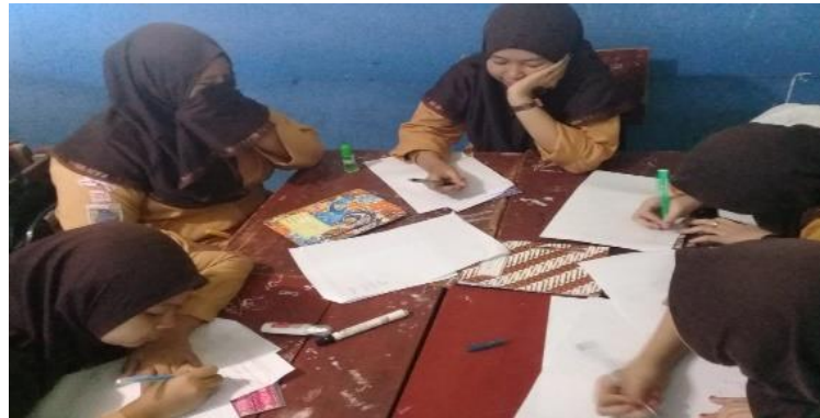
Gambar I. Membagikan lembar kerja kelompok siswa