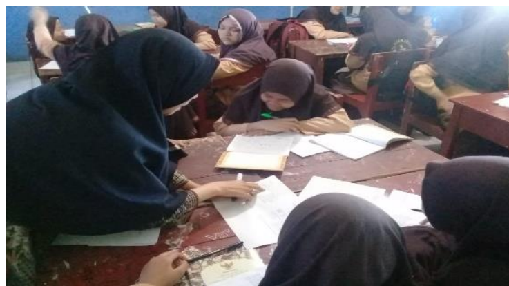
Gambar II. aktivitas siswa membuat hipotesis

Setelah pembagian kelompok dan peneliti menyajikan pertanyaan atau masalah. Pada fase ini peneliti memberikan kesempatan pada siswa untuk curah pendapat dalam membentuk hipotesis. Pada kegiatan ini siswa terlihat antusias, sebagian besar siswa memberikan pendapatnya, lalu guru memberikan kesempatan kepada masing-masing perwakilan kelompok untuk menyampaikan pendapat. Ketika mereka memberikan pendapatnya dalam membentuk hipotesis ada sebagian kelompok yang hipotesisnya benar dan ada juga yang salah. Peneliti membimbing siswa dalam menentukan hipotesis yang relevan dengan permasalahan.