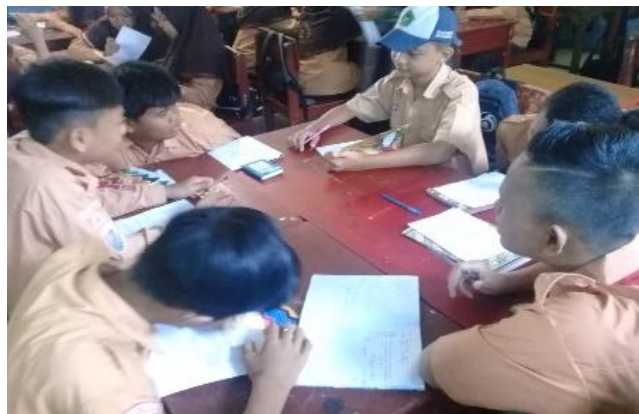
Gambar X. Aktivitas siswa menganalisis data

Pada fase ini siswa berdiskusi tentang data-data yang diperoleh. Setelah selesai peneliti memberikan kesempatan pada tiap kelompok untuk menyampaikan hasil pengolahan data yang terkumpul. Masing-masing perwakilan kelompok menyampaikan hasil dari data yang terkumpul.