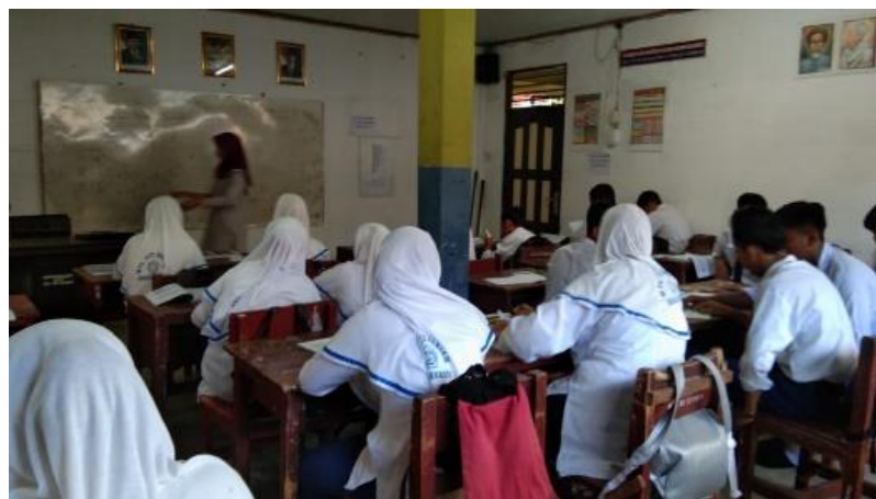
Gambar VII. Peneliti Menjelaskan Materi Pembelajaran

Peneliti menjelaskan materi pembelajaran dan memberikan kesempatan pada siswa (i) untuk menanyakan hal-hal yang belum dimengerti.