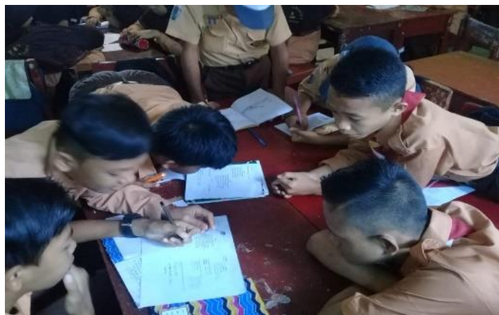
Gambar III. Aktivitas siswa merancang percobaan

Pada fase ini peneliti memberikan kesempatan pada siswa untuk menentukan langkah-langkah yang sesuai dengan hipotesis yang akan dilakukan. Setiap kelompok berdiskusi untuk menentukan langkah-langkah percobaan. Setelah itu, peneliti memberikan kesempatan kepada siswa untuk menyampaikan hasil diskusinya dalam menentukan langkah-langkah percobaannya dan peneliti membimbing siswa mengurutkan langkah-langkah percobaannya.