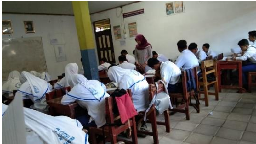
Gambar VIII. Peneliti Memberikan Tes Individu pada Siswa

Peneliti memberikan latihan soal berupa tes individu yang bertujuan untuk mengetahui perkembangan peningkatan pengetahuan mereka terhadap materi yang telah dipelajari.