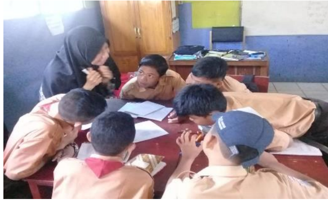
Gambar IV. Aktivitas siswa memperoleh informasi