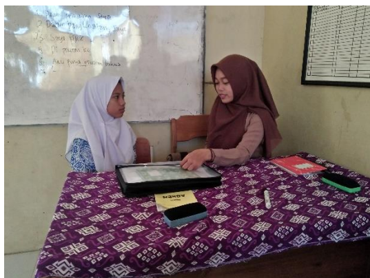
Interview SMPN 2