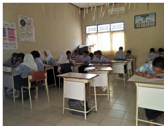
VIII - B