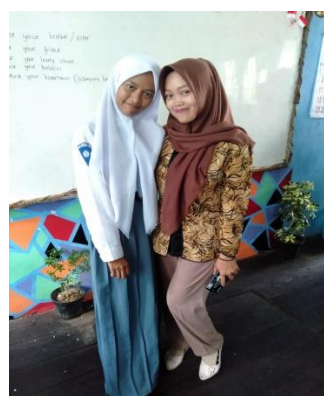
Interview SMAN 2