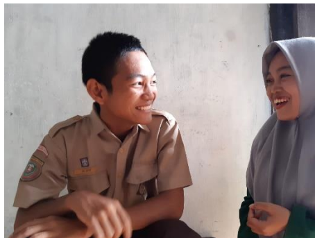
Interview SMAN 1