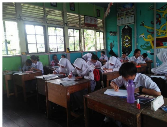
X MIPA 1