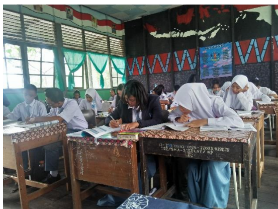
X MIPA 2