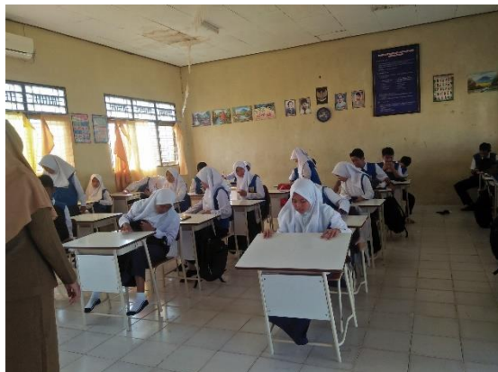
IX - C