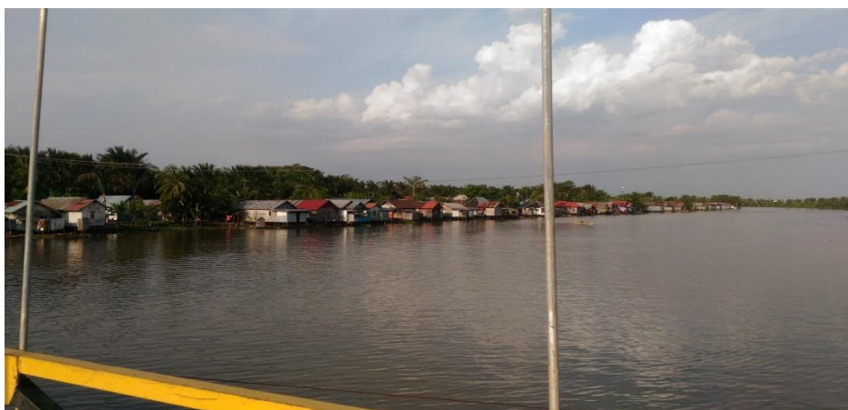
(Desa Baringin B Kecamatan Candi Laras Selatan Kabupaten Tapin)