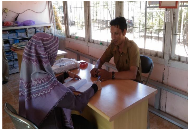
(Wawancara dengan Aparat Desa 29 Juli 2019)