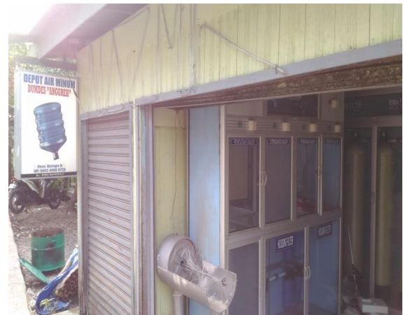
(Unit Usaha Depot Air Minum)