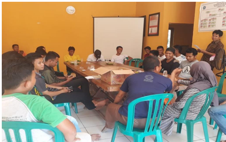
(Dokumentasi MUSDes Tahun 2018)