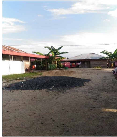
(Unit Usaha Trading Pengadaan Barang dan Jasa)