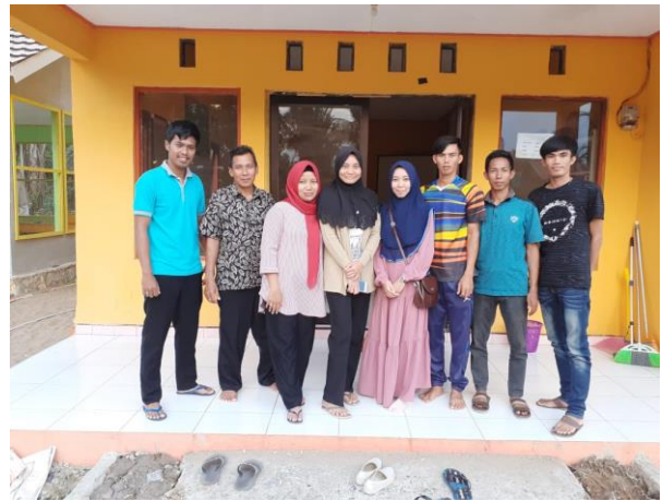
(Wawancara dengan Manager, Bendahara dan Administrasi serta Anggota BUMDes Angrek 25 Juli 2019)