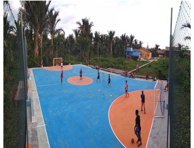
(Gedung Badminton dan Lapangan Futsal, Unit Usaha Rental)