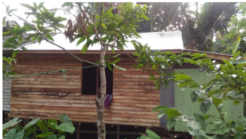
(Rumah Warga Yang Menggunakan Dana Pembugaran Perumahan)