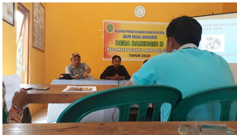
(Pelatihan Pengurus BUMDes Desa Baringin B)