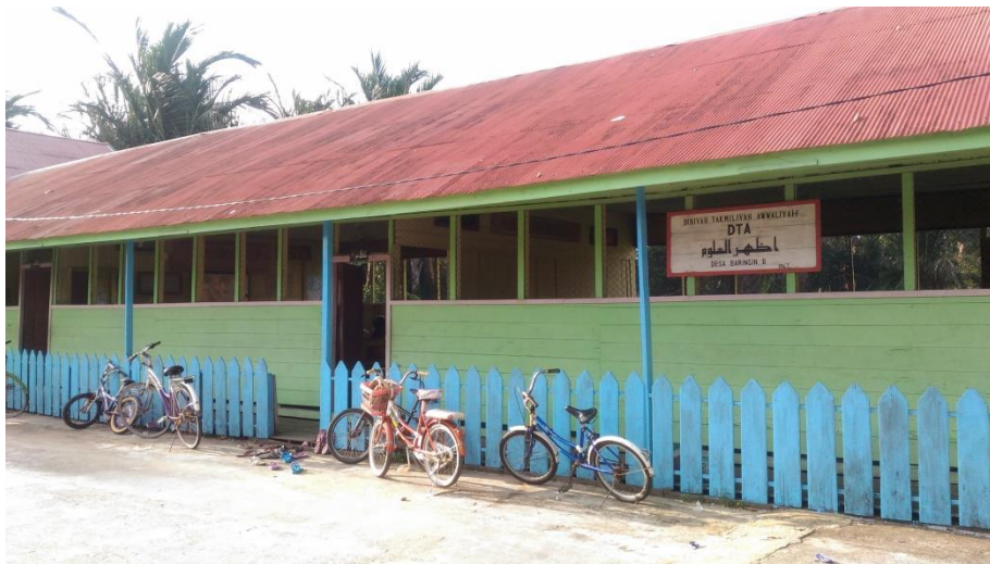
(Sekolah Diniyah Takmiliyah Awwaliyah Yang Menerima Dana Pendidikan dari BUMDes)