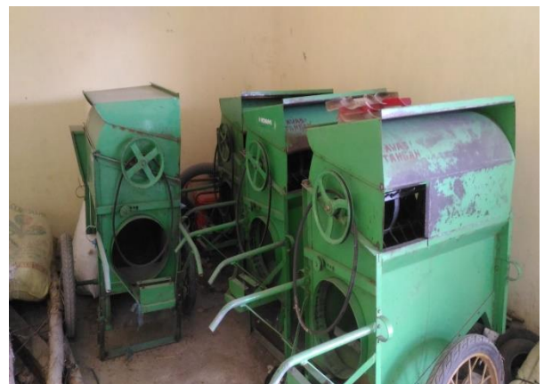
(Gudang Penyimpanan Padi dan Alat-alat Pertanian Unit usaha Trading)