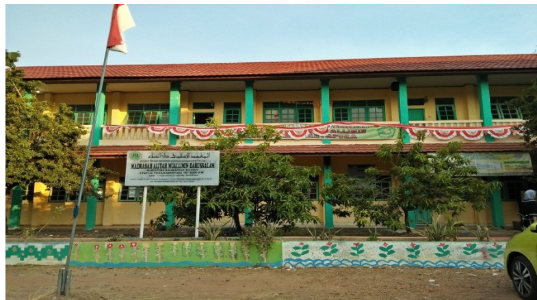
Gambar 1.12 Madrasah Darussalam Tahfidz dan Ilmu Al-Qur'an Martapura