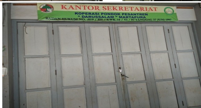
Lembaga pendidikan yang dibawah naungan pondok pesantren Darussalam Martapura Gambar 1.9 Lembaga pendidikan SMK Darussalam