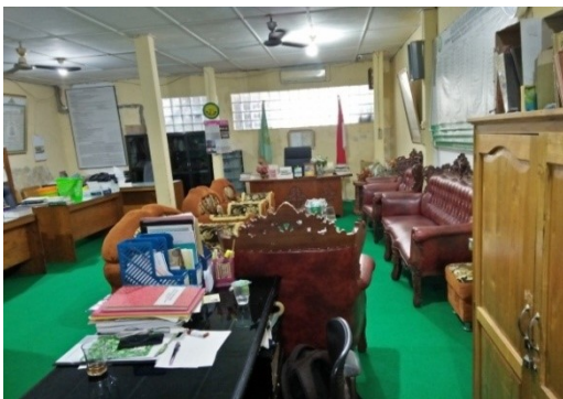
Gambar 1.5 Kantor pengurus pondok pesantren Darussalam Martapura