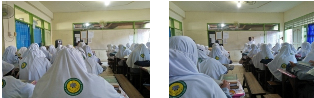
Gambar 1.2 Kegiatan belajar santri putri di dalam kelas