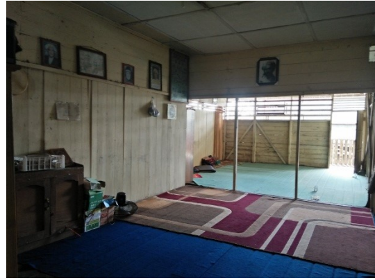
Sumber data : Milik Peneliti Gambar 1.7 Ruang shalat santri