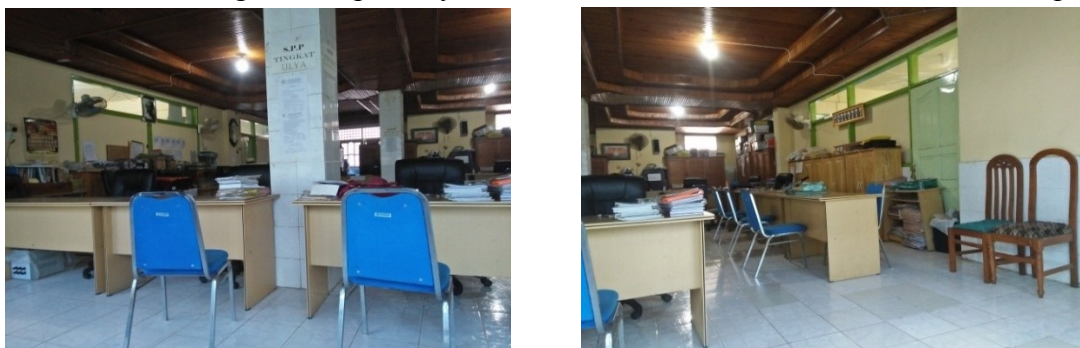
Gambar 1.4 Ruang istirahat guru dan ruang tamu