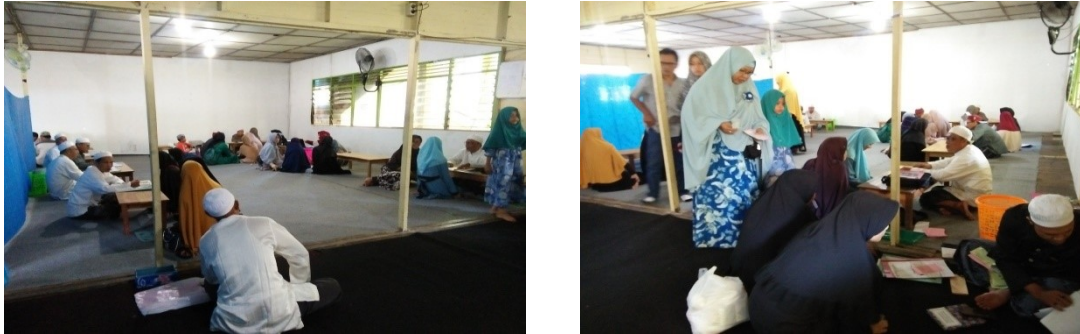
Gambar 1.1 Kegiatan penerimaan santri putri baru dan lama