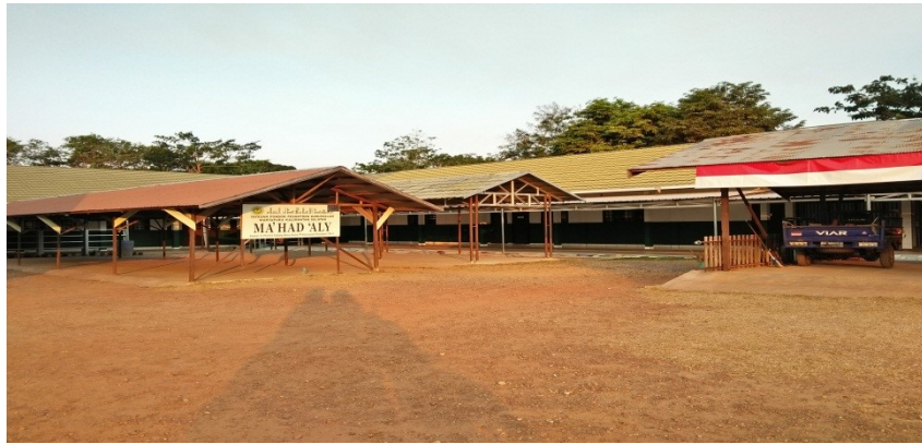
Gambar 1.14 Institut Agama Islam Darussalam (IAID) Martapura