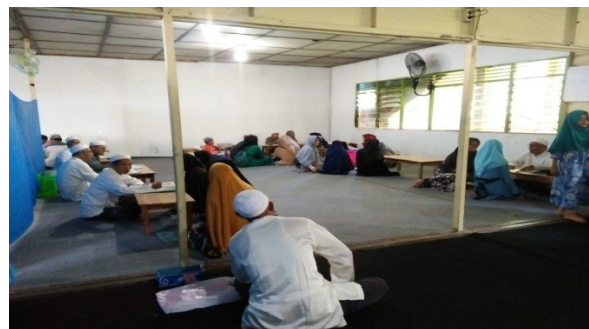
GAMBAR 4.1 Dokumentasi Pada Saat Pendaftaran Santri Putri Baru Di Pondok Pesantren Darussalam Martapura